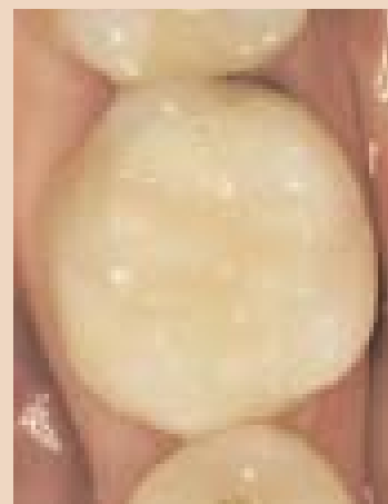
Fertige Restauration mit EQUIA.

Die aktuelle Datenlage legt zudem nahe, das Potenzial von GIZ der neuesten Generation auch im Vergleich mit Amalgam neu zu bewerten. Basierte die Sicht auf GIZ bisher auf nichtsystematischen Reviews von überwiegend nichtrandomisierten klinischen Langzeitstudien, zogen neuere Erkenntnisse von Mickenautsch und Yengopal randomisierte kontrollierte Studien (RCT = Randomized Clinical Trials) heran, was hinsichtlich der abschliessenden Beurteilung eine wesentlich höhere Aussagekraft mit sich bringt. Diese Studien fanden keine klinisch signifikanten Belege für die Aussage, dass direkte Restaurationen mit hochviskosen Glasionomeren bei mehrflächigen Versorgungen im Zeitraum bis vier Jahren sowie bei einflächigen Versorgungen bis sechs Jahren Amalgamfüllungen unterlegen wären. 8,9,10