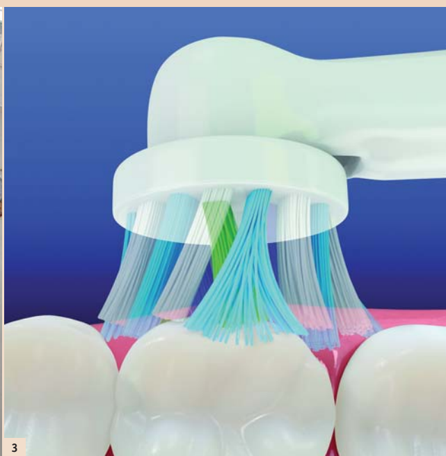
Abb. 2: Aus der Luftfahrt bekannt, für die zahnmedizinische Prophylaxe interessant: Schubspannung wirkt auf die Oberfläche eines umströmten Körpers, schafft aber eine effektive Plaqueentfernung nur bei Borstenkontakt. – Abb.3: Als entscheidend erweist sich, dass die durch die Borsten ausgeübten Scherkräfte die Adhäsionskräfte des Biofilms überwinden.