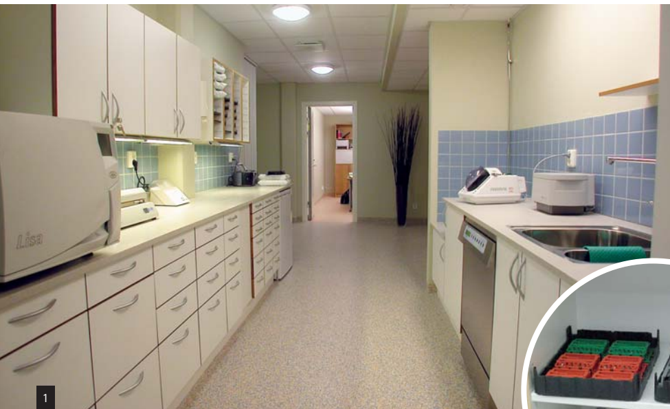
Abb. 1: Zentrale Stationen, die sogenannten „Tray-Preps“ für die Vorbereitung jeder spezifischen Behandlung, sind eine Methode zur Minderung des Bedarfs an Instrumenten. Diese Methode erhöht somit die Qualität und reduziert die Kosten. – Abb. 2: Große Vorratsmengen machen mehrere gleiche Instrumente und zahlreiche Schränke nötig. Unter finanziellem Aspekt spricht viel für die Reduzierung der Produktmenge und die damit einhergehenden Einsparungen an Platz und Arbeitszeit.

Klinische Arbeit erfordert verschleißfeste und hygienische Produkte, die die hohe Belastung täglicher dentalmedizinischer Aufgaben tolerieren und auch deren übrige Anforderungen erfüllen. Dazu kommen der Anspruch einer langen Lebensdauer und eine komfortable Anschaffungslogistik. Außerdem spielt ein professioneller visueller Eindruck eine große Rolle.