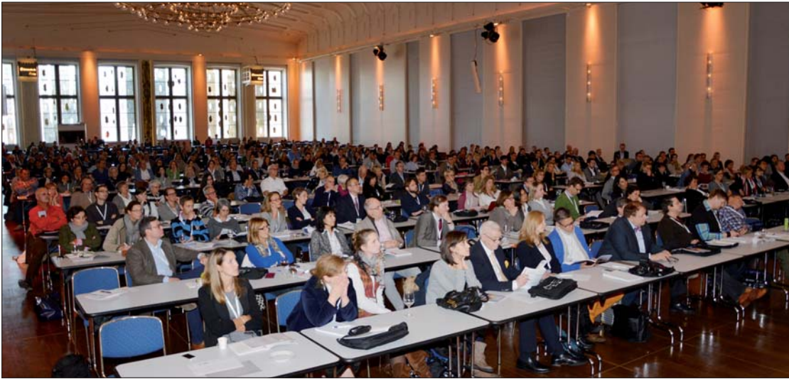
Der Wissenschaftliche Kongress für Aligner-Orthodontie fand erstmals 2010 statt. Seitdem lädt er alle zwei Jahre an der Alignertherapie interessierte Kieferorthopäden zum Erfahrungsaustausch ein.

3. Wissenschaftlicher DGAO-Kongress gab Ausblick in die Zukunft der Alignertherapie.