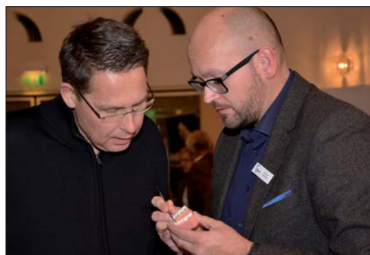
Rund 20 Firmen waren in der parallelen Industrieausstellung mit einem Stand vertreten und präsentierten ihre Produkte.