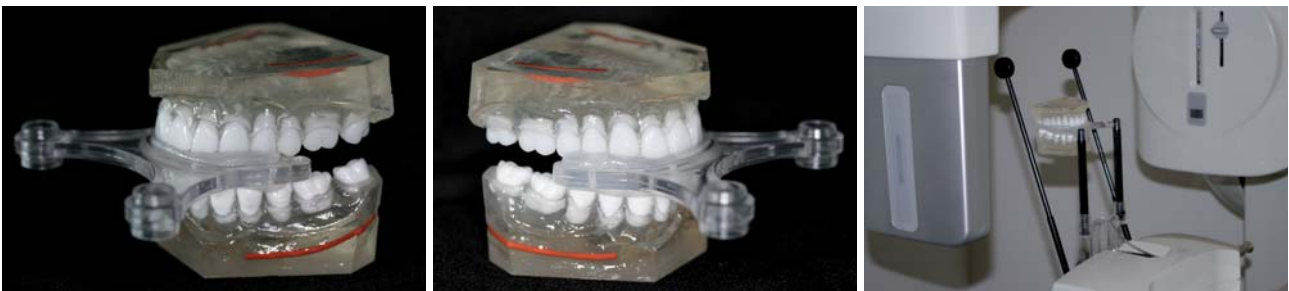
Abb. 1 und 2: DVT-Phantom („Kieferhöhlenboden“ und „Nervus alveolaris mandibulae“ sind mit röntgendichten Drahtstrukturen simuliert). – Abb. 3: DVT-Phantom in einem Volumentomografen (Kodak 9000 3-D, kleines Volumen) auf der Original-Patienten-Einbisshilfe fixiert.

Geräte mit kleinem und mittlerem Volumen werden in der Regel in oralchirurgisch tätigen und zahnärztlichen Praxen