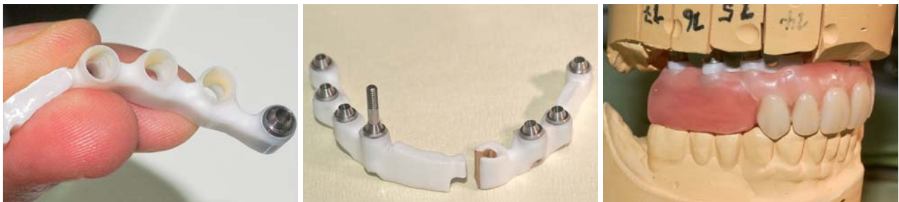
Abb. 16: Auf den Innenflächen der Stegkonstruktion aufgebrachter Kleber. – Abb. 17: Der im Mund mit den Titanklebebasen verklebte Steg. – Abb. 18: Die in das Modell zurückgesetzte Stegkonstruktion mit Bissregistrierung und am Patienten überprüfter Frontzahnästhetik.

Bei der Gestaltung des Zirkonsteges berücksichtigen wir immer die Ästhetikaufstellung. Diese wurde im Vorfeld bei der Patientin überprüft und mit ihr besprochen. Die Form und Ausdehnung des Steges wird entsprechend der Ästhetikaufstellung ausgerichtet. Da wir in diesem Fall mit dem Doppelscanverfahren arbeiten, wird der Steg zuerst aus Kunststoff gefertigt und einige kleinere Teile in Wachs ergänzt. Mit moderner CAD/CAM-Technologie (Imes/ZENO Verfahren) wird diese Stegmodellation eingescannt und mit der ebenfalls eingescannten Modellsituation über Image Matching zusammengeführt. Die fertig konstruierten Daten werden an die CAM-Fräsanlage gesendet und