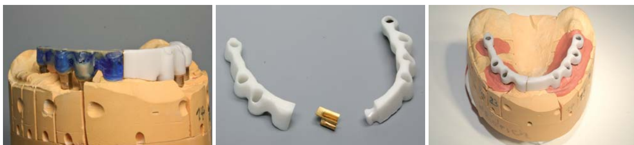
Abb. 7: Fertiggefräster Zirkonoxidsteg mit anmodelliertem zweiten Stegteil. – Abb. 8: Beide Stegelemente mit Galvanopuffer des Steggeschiebes. – Abb. 9: Die fertiggefräste Stegkonstruktion mit Teilungsgeschiebe.

in die Planung der Implantatpositionen mit einzubeziehen.