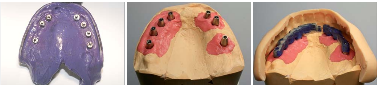
Abb. 4: Abdruck mit reponierten Abdruckpfosten. – Abb. 5: Modell mit Zahnfleischmaske und mit herausnehmbaren Sägestümpfen. – Abb. 6: Stegmodellation in Kunststoff und Wachs mit Vorwällen der Ästhetikaufstellung.