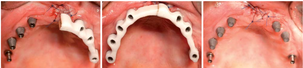
Abb. 13: Nach Explantation und Einprobe der Stegkonstruktion im zweiten Quadranten. – Abb. 14: Der Sheffield-Test bestätigte das spannungs- und spaltfreie Aufsitzen der Stegstruktur. – Abb. 15: Die zum Verkleben eingeschraubten und vorbereiteten Titanklebebasen.