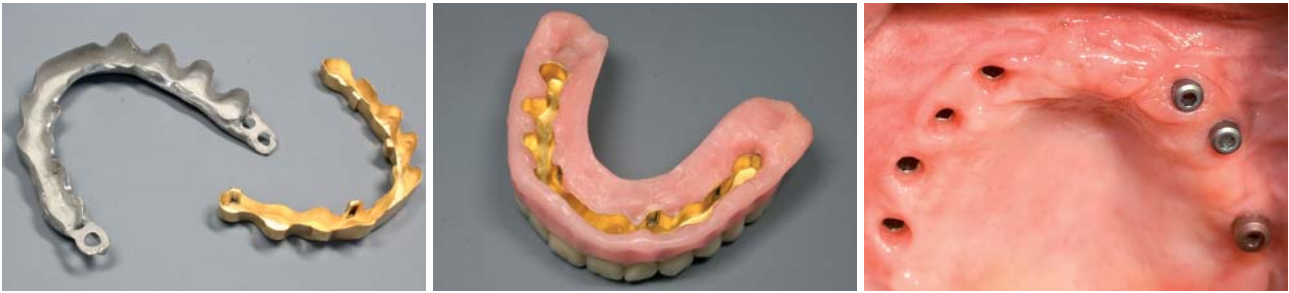
Abb. 19: Sekundär- und Tertiärgerüst. – Abb. 20: Beide Gerüste verklebt und mit der fertigen Aufstellung. – Abb. 21: Freigelegte Implantate und entzündungsfrei ausgeheilte Weichgewebe.