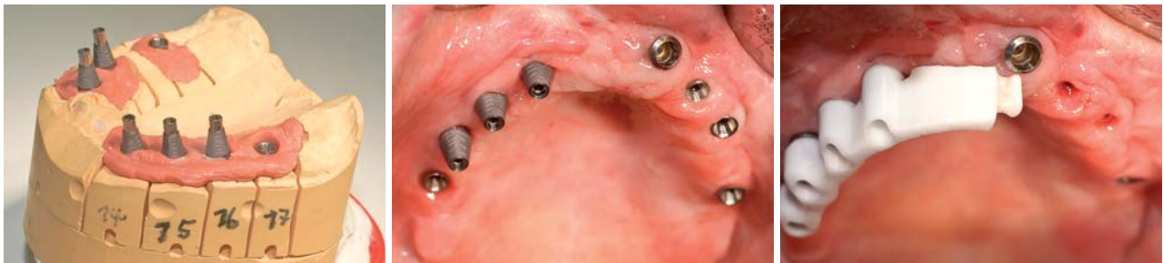
Abb. 10: Die Titanklebebasen mit zusätzlichen Retentionsrillen. – Abb. 11: Intraoral in die Implantate eingeschraubte Titanklebebasen. – Abb. 12: Aufgesetzte Stegkonstruktion vor Explantation des aus der alten Versorgung stammenden Implantates. Für die prothetische Versorgung ungünstige Implantatposition.