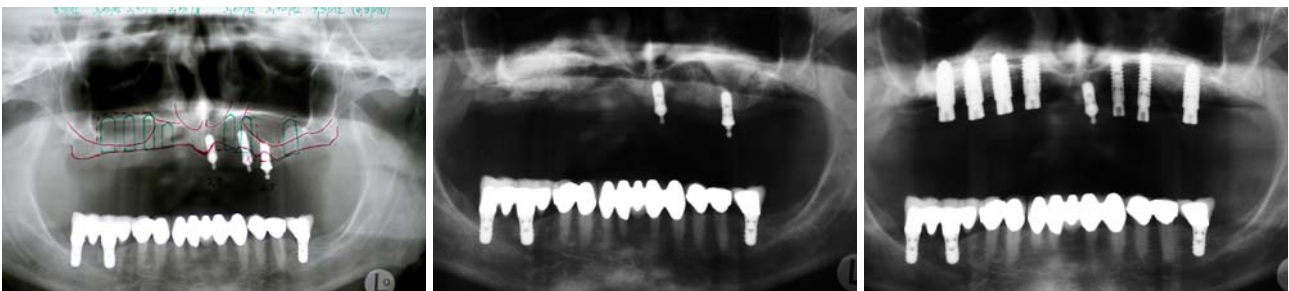
Abb. 1: OPG-Behandlungsplanung. – Abb. 2: OPG nach Augmentation des Sinus maxillaris rechts und links. – Abb. 3: OPG nach Eröffnung der Implantate und eingesetzten Sulkusformern.

Nach eingehender Beratung und ausführlicher Diagnostik haben wir uns, den Wünschen und Vorstellungen der Patientin entsprechend, gemeinsam mit ihr für eine bedingt abnehmbare Brücke auf einer implantatgestützten Stegkonstruktion aus Zirkonoxid und galvanotragener Suprakonstruktion entschieden. Hierzu war es erforderlich, sieben Implantate in den zahnlosen Oberkiefer zu inserieren. Die zum Zeitpunkt der chirurgischen Behandlungsphase noch in situ befindlichen, aber nicht erhaltungswürdigen Implantate sollten zur Übergangsversorgung mit der vorhandenen prothetischen Konstruktion genutzt werden und waren somit