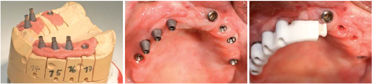
Abb. 10: Die Titanklebebasen mit zusätzlichen Retentionsrillen. – Abb. 11: Intraoral in die Implantate eingeschraubte Titanklebebasen. – Abb. 12: Aufgesetzte Stegkonstruktion vor Explantation des aus der alten Versorgung stammenden Implantates. Für die prothetische Versorgung ungünstige Implantatposition.