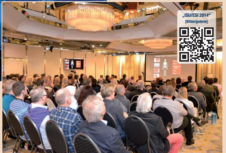
Im letzten Jahr war der Kongress gut besucht.

Jeder Teilnehmer erhält das in der 21. Auflage erscheinende Jahrbuch Implantologie 2015 – das aktuelle und komplett überarbeitete Kompendium