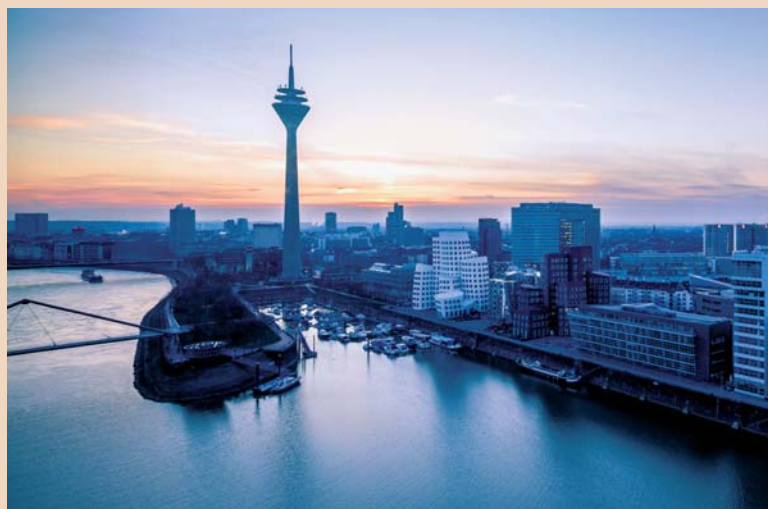
Am 24. und 25. April 2015 findet in Düsseldorf die Veranstaltungskombination IMPLANTOLOGY START UP und EXPERTENSYMPOSIUM „Innovationen Implantologie“ statt.

Die Veranstaltungskombination IMPLANTOLOGY START UP und EXPERTENSYMPOSIUM „Innovationen Implantologie“ gehört zu den traditionsreichsten deutschen Implantologie-Events und eröffnet seit 1994 rund 4.000 Zahnärzten den Weg in die Implantologie bzw. begleitete mehr als 2.200 von ihnen in der Folgezeit auch als Anwender. Erklärtes Ziel und eine Grundlage des Erfolgs war stets das Bemühen, auch neue Wege zu gehen und das Konzept der Veranstaltung weiterzuentwickeln. Neben der Zusammenarbeit mit den implantologischen Praktikergesellschaften ist dies seit einigen Jahren vor allem auch die Kooperation mit regionalen Partnern aus der Wissenschaft. Neben dem UKE, Hamburg, waren in den letzten Jahren u. a. die Technische Universität München, die Universität Witten/Herdecke und die Charité, Berlin,