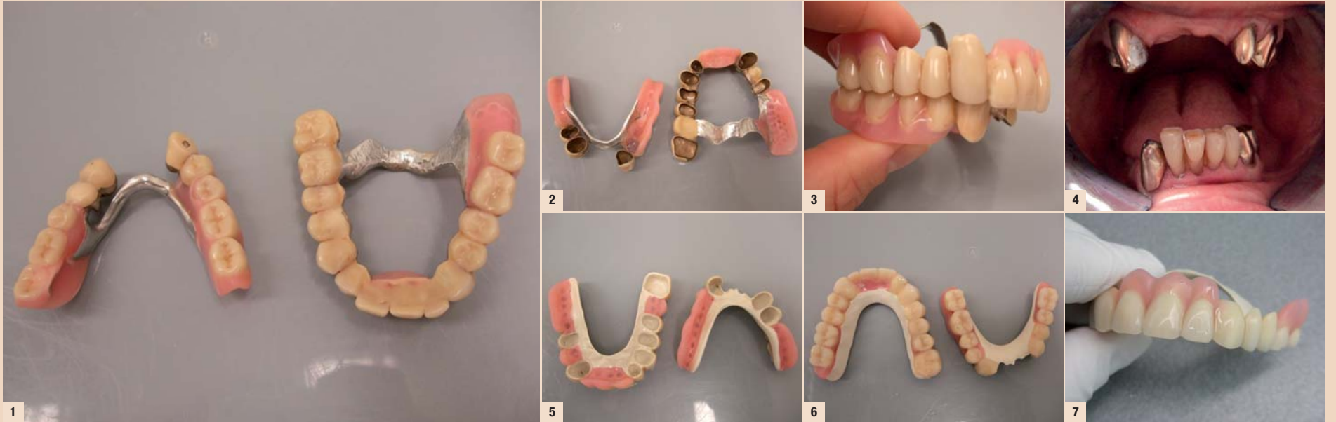
Abb. 1–10: Patientenfall 1.

Mit dem Hochleistungskunststoff PEEK (PolyEtherEtherKeton) wurde eine neue Art Material geschaffen, das auf vielen Gebieten der Industrie und Technik den Markt revolutionieren wird. Von Claudia Herrmann, Bad Tölz, Deutschland.