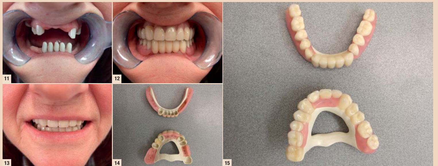
Abb. 11–15: Patientenfall 2.

Bei Teleskopprothesen aus PEEK wird kein zusätzliches Friktionsteil benötigt. Die Primärkrone wird aus Zirkon hergestellt. Die Sekundärkrone samt Gerüst und Bügel besteht aus PEEK. Die Friktion