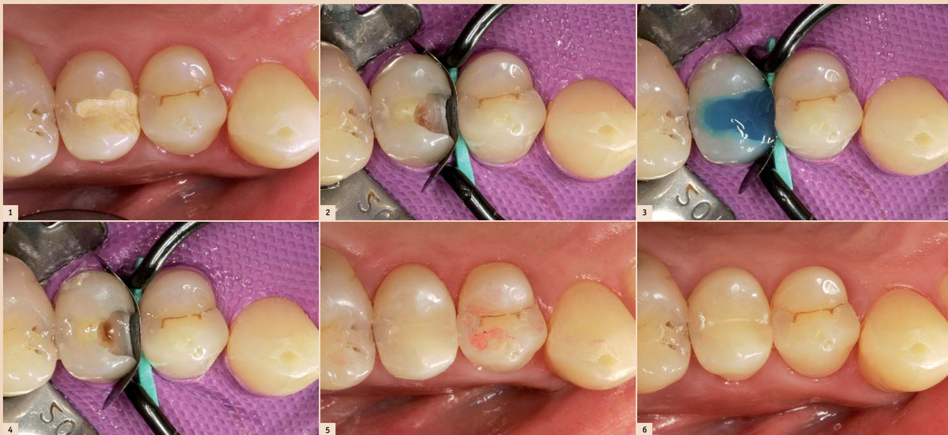
Abb. 1: Biodentine Interimsversorgung an Zahn 15. – Abb. 2: Die mit der Polydentia LumiContrast-Teilmatrize in Kombination mit dem dazugehörigen Spannring einfach dargestellte Kavität unter Kofferdamisolierung. – Abb. 3: Konditionierung der Kavität mit Phosphorsäuregel. – Abb. 4: Versiegelung der Kavität mit einem klassischen Mehrflaschenadhäsiv. – Abb. 5: Ausgearbeitete und polierte Restauration (Zahn 15). – Abb. 6: Der versorgte Zahn 15 bei einem weiteren Kontrolltermin nach einem Jahr.

Der LumiContrast-Spannring kann in zwei Varianten verwendet werden: Zum einen so wie in der Abbildung zu sehen, entsprechend einem klassischen Garrison Silver-Spannring. Es besteht aber zusätzlich die Möglichkeit, kleine dreiecksförmige Silikonhülsen aufzustecken,