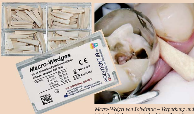
Macro-Wedges von Polydentia – Verpackung und klinisches Bild einer sehr tiefen Läsion/Kavität.

Klinische Untersuchungen belegen, dass Holzkeile eine sehr gute, nahezu perfekte anatomische Form aufweisen, sich der natürlichen Kontur der Zähne anpassen und zusätzlich durch das Aufquellen eine abdichtende Wirkung auf die Matrizen haben. Gleichzeitig erweist die Kombination mit dem Astringens der Macro-Wedges und auch der Hemo-Wedges eine weitgehende Verringerung oder gar Elimination von Blutungen, besonders bei Patienten mit leichter oder mittlerer Gingivitis.