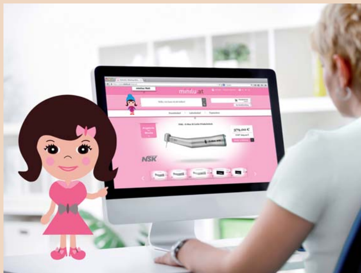
Die niedliche Comicfigur minilu gibt Praxistipps für effizienteres Arbeiten.

Damit lassen sich Einkaufszettel speichern und das Nachbestellen von Lieblingsprodukten wird kinderleicht. Um zu gewährleisten, dass immer alles korrekt ist, können minilu-Kunden außerdem verschie-