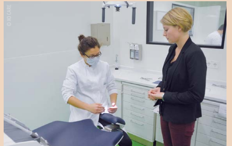
Ein rundum erneuerter Arbeitsplatz für Studierende der Klinik für Zahnerhaltung, Parodontologie und Präventive Zahnheilkunde des Uniklinikums Aachen.

Blau und Grau bestellt. Bei der Auswahl der Einheiten wurde auch die kompakte Bauweise berücksichtigt, denn pro Kurs mit 32 Teilnehmern teilen sich zwei Studierende einen Arbeitsplatz. Darüber hinaus wurden zwei Fortbildungsräume für Kinder- und Laserzahnmedizin mit den XO