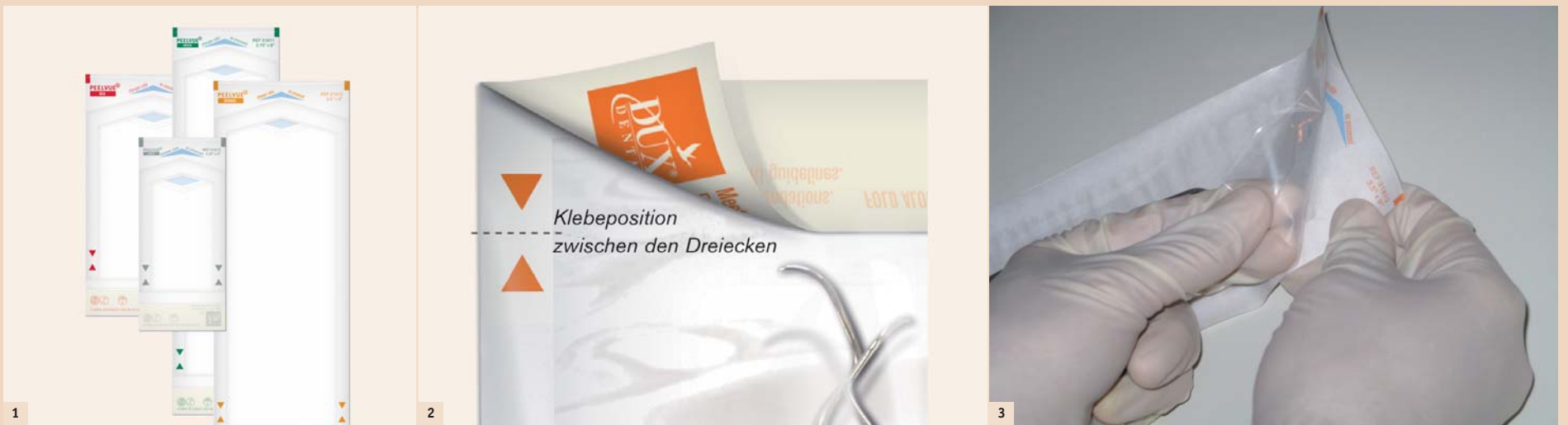
Abb. 1–3: So einfach ist die Handhabung der PeelVue + Selbstklebebeutel. – Abb. 1: Aus zwölf Größen das passende Beutelformat auswählen. – Abb. 2: Befüllen und validierbar verschließen. Innere und äußere Prozessindikatoren sind bereits integriert. – Abb. 3: Einfaches und richtlinienkonformes Öffnen.

PeelVue + – Zeit sparen durch Umstellung des Verpackungsverfahrens.