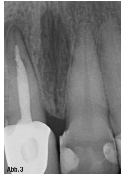
▲ Abb. 1 bis 3: Mit diesen Aufnahmen vom 26.9.2013, 28.1.2014 und 20.2.2014 stellte sich die Patientin vor.

handlung in wenigen Monaten verloren. Kann der Prozess durch Beseitigung der Keimbeseidlung in einen Heilungsvorgang umgewandelt werden, kommt es im günstigen Fall zur Ersatzresorption (Ersatzgewebsresorption, replacement resorption, osseus replacement). Das ausheilende Gewebe wird durch Osteoblasten in Knochen umgewandelt. Der Zahn wird sukzessive durch Knochen ersetzt. Beim Erwachsenen geht dieser Prozess recht langsam voran, sodass der Zahn oft noch Jahre erhalten bleiben kann, im Mittel drei bis sieben Jahre. Durch