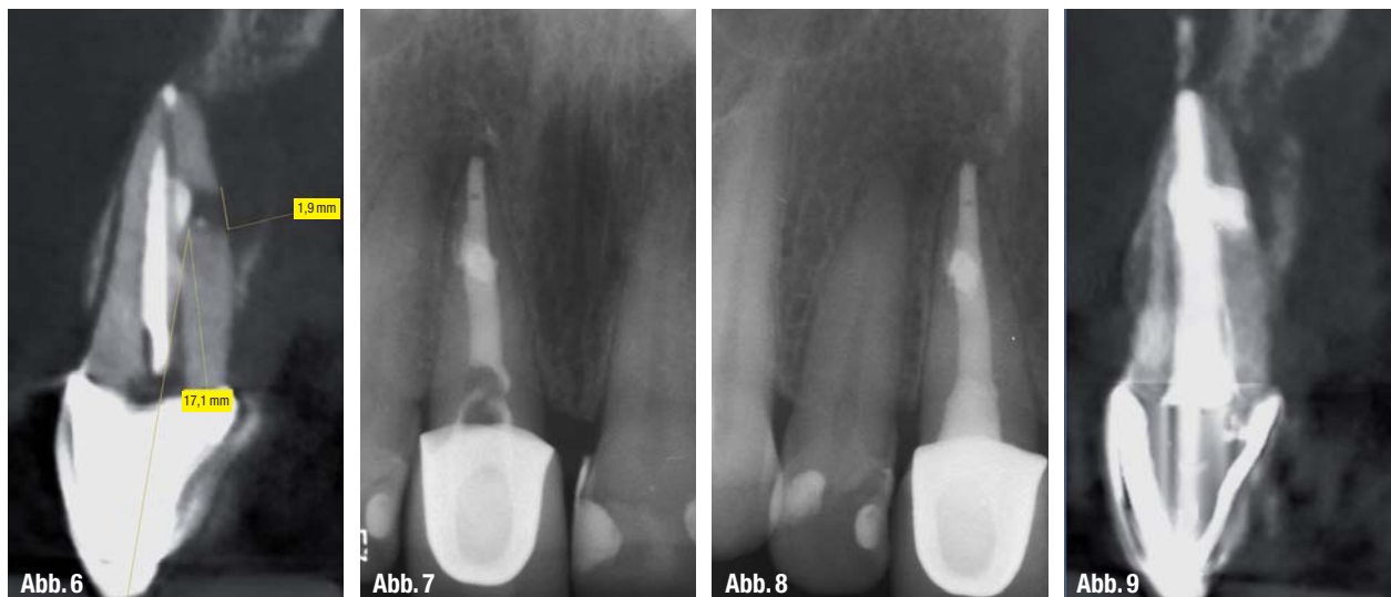
▲ Abb. 6: Analyse des DVT-Screenshots und Lageberechnung der Perforation. ▲ Abb. 7: Röntgenbild nach Einbringen von Sealer und Guttapercha sowie adhäsivem Verschluss. ▲ Abb. 8: Kontrollaufnahme in der 6. Sitzung am 26.9.2014. ▲ Abb. 9: Auf einer erneuten DVT-Aufnahme von Dezember 2014 ist die gute Knochenregeneration zu sehen.