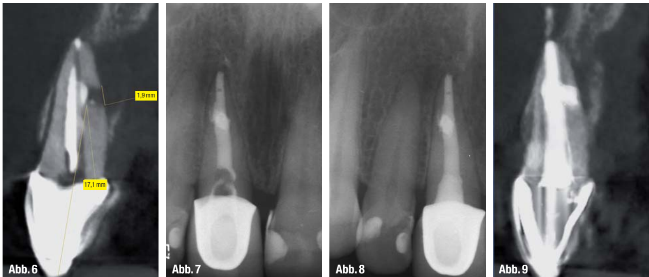
▲ Abb. 6: Analyse des DVT-Screenshots und Lageberechnung der Perforation. ▲ Abb. 7: Röntgenbild nach Einbringen von Sealer und Guttapercha sowie adhäsivem Verschluss. ▲ Abb. 8: Kontrollaufnahme in der 6. Sitzung am 26.9.2014. ▲ Abb. 9: Auf einer erneuten DVT-Aufnahme von Dezember 2014 ist die gute Knochenregeneration zu sehen.