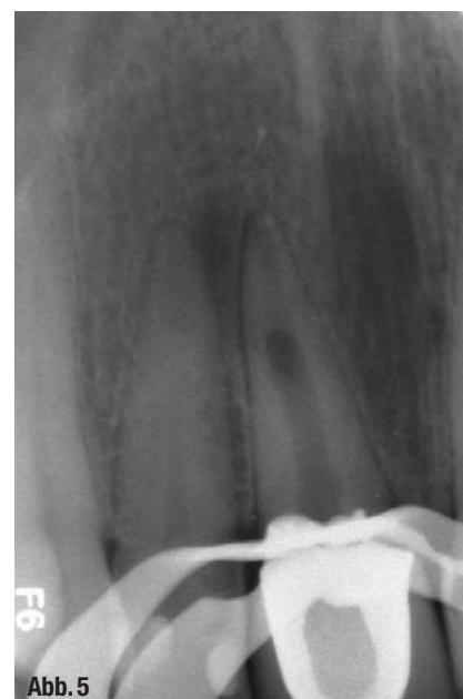
▲ Abb. 4: DVT-Screenshot von Zahn 11 für eine detailliertere Darstellung. ▲ Abb. 5: 1. Therapie-sitzung mit Entfernung der Wurzelfüllung und Aufbereitung des Zahns.