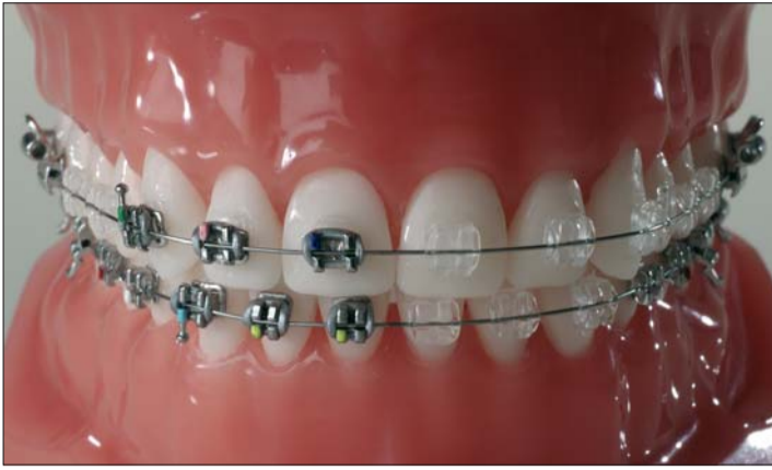
Abb. 4: Einsatz verschiedener Bracketsysteme bei einem Patienten.