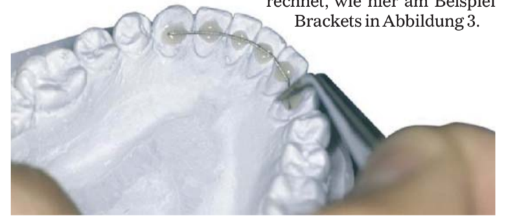
Abb. 2: Private Zusatzleistung „Frontzahretainer“.

ist, denn nur so hält sie Überprüfungen stand, ist sie objektivierbar und verständlich. Nichts ist schädlicher als undurchsichtige und vage Preisschätzungen. Handelt es sich um eine medizinisch notwendige Leistung, dann ist sie in der GOZ oder der GOÄ enthalten. In der Regel werden die Mehrkosten zwischen dem Kassen- und Privathonorar berechnet, wie hier am Beispiel Brackets in Abbildung 3.