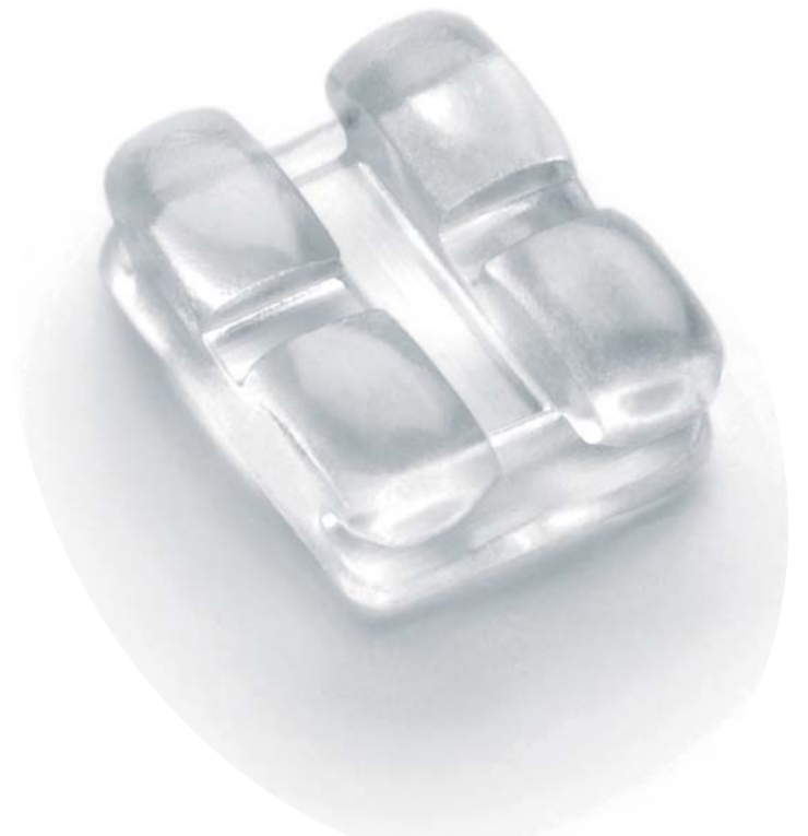
Abb. 5: Inspire Ice-Bracket – eine sehr schöne Lösung, allerdings keine Kassenleistung!

halten, als gezahlt/vereinbart)? Werden alle diese Fragen reibungslos beantwortet, die Preise angemessen kalkuliert und vor allem die Patienten ausführlich im Vorfeld des Geschehens aufgeklärt, so beweist dies Qualität und Transparenz der Praxis. Eine Praxis, die erfolgreich mit außervertraglichen Leistungen umzugehen weiß. KN