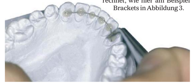
Abb. 2: Private Zusatzleistung „Frontzahretainer“.

ist, denn nur so hält sie Überprüfungen stand, ist sie objektivierbar und verständlich. Nichts ist schädlicher als undurchsichtige und vage Preisschätzungen. Handelt es sich um eine medizinisch notwendige Leistung, dann ist sie in der GOZ oder der GOÄ enthalten. In der Regel werden die Mehrkosten zwischen dem Kassen- und Privathonorar berechnet, wie hier am Beispiel Brackets in Abbildung 3.