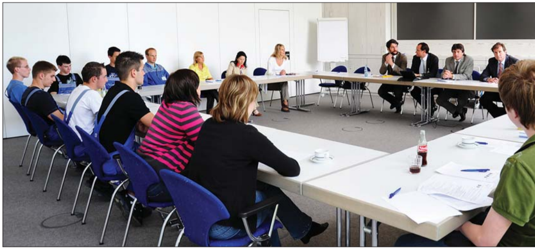
Die DENTAURUM-Gruppe bildet jährlich 20 bis 25 Azubis in den Berufen Werkzeugmechaniker/-in und Industriekaufmann/-frau aus. Dass die Jugendlichen sich um ihren Platz in Europa Gedanken machen, bewies die Gesprächsrunde in Ispringen.

verdeutlichte zu Beginn der Veranstaltung, dass es äußerst wichtig sei, jungen Menschen die Bedeutung eines starken und geeinten Europas näherzubringen und ihnen die Chancen aufzuzeigen, die eine qualifizierte Ausbildung bietet. Bei der DENTAURUM-Gruppe werden jährlich 20 bis 25 Azubis in den Berufen Werkzeugmechaniker/-in und Industriekaufmann/-frau ausgebildet. Die Auszubildenden hatten sich im Vorfeld intensiv mit dem Thema Europa beschäftigt und sich zahlreiche interessante Fragen überlegt. Zunächst wollten sie etwas zur Person Gunther Krichbaum und dessen beruflichen Werdegang wissen und welche Ziele er regional wie auch europaweit in naher Zukunft verfolgt. Es interessierte sie, was ihnen Europa beruflich bietet. Aber auch die Sorgen um