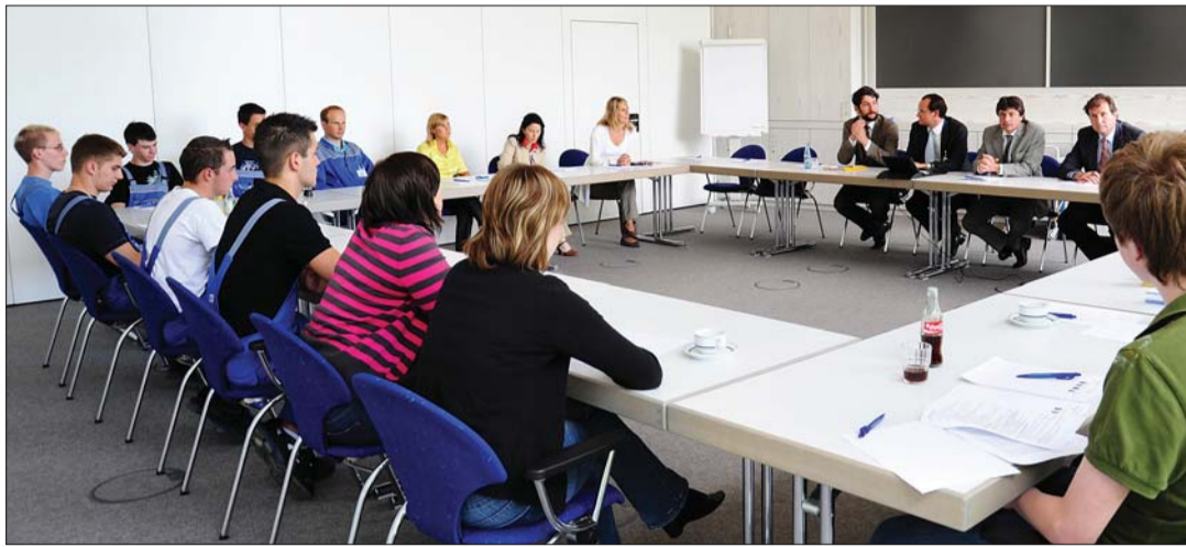
Die DENTAURUM-Gruppe bildet jährlich 20 bis 25 Azubis in den Berufen Werkzeugmechaniker/-in und Industriekaufmann/-frau aus. Dass die Jugendlichen sich um ihren Platz in Europa Gedanken machen, bewies die Gesprächsrunde in Ispringen.

verdeutlichte zu Beginn der Veranstaltung, dass es äußerst wichtig sei, jungen Menschen die Bedeutung eines starken und geeinten Europas näherzubringen und ihnen die Chancen aufzuzeigen, die eine qualifizierte Ausbildung bietet. Bei der DENTAURUM-Gruppe werden jährlich 20 bis 25 Azubis in den Berufen Werkzeugmechaniker/-in und Industriekaufmann/-frau ausgebildet. Die Auszubildenden hatten sich im Vorfeld intensiv mit dem Thema Europa beschäftigt und sich zahlreiche interessante Fragen überlegt. Zunächst wollten sie etwas zur Person Gunther Krichbaum und dessen beruflichen Werdegang wissen und welche Ziele er regional wie auch europaweit in naher Zukunft verfolgt. Es interessierte sie, was ihnen Europa beruflich bietet. Aber auch die Sorgen um