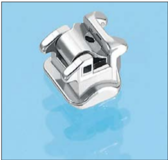
Quick>>2.0® – ein perfekt aufeinander abgestimmtes Bracketsystem für optimale Behandlungsergebnisse.

Das Quick®-Bracket von FORESTADENT verletzt keine GAC-Lizenz. Zu diesem Ergebnis kamen am 7. Juli 2009 nun auch die Richter des US-