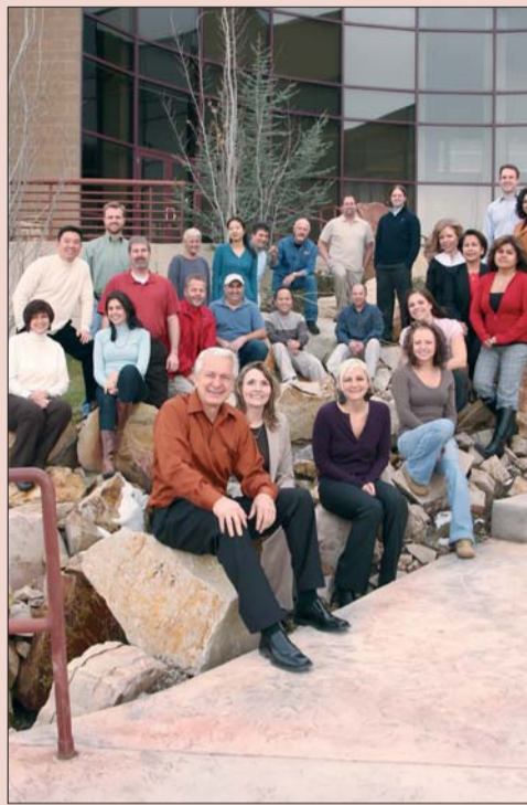
Südlich von Salt Lake City, Utah, steht die moderne Entwicklungs- und Produktionsstätte von ULTRADENT Products mit inzwischen ca. 800 Mitarbeitern. Kreativität, Engagement und eine Mannschaft, die hinter ihrem Chef und Vordenker steht, sind wichtige Faktoren für den Erfolg von ULTRADENT Products in nunmehr 30 Jahren.

auf dem Gebiet der Zahnaufhellung, mit umfangreichen Möglichkeiten. Gerade sorgt trèwhite supreme, das „Bleaching to go“, für Furore. Auch weitere UP-Produkte kennt inzwischen fast jeder (Fach-)Zahnarzt, z. B. Ultra-Etch, das leuchtend blaue Phosphorsäure-Gel, bei dem nicht nur Farbe und Konsistenz überzeugen, sondern auch die Selbstlimitierung: So wird das Dentin optimal zur Aufnahme eines Bondings vorbereitet, um hohe Haftwerte zu erzielen und postoperative Sensibilitäten zu vermeiden. Große Bedeutung hat die Spritzen-Applikation: Mit feinen Applikatoren und Bürstchen werden Materialien auch an schwer zugängliche Stellen gebracht. Dies