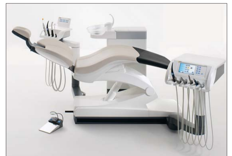
Der erste iF gold award-Gewinner aus der Dentalbranche: die Behandlungseinheit TENEO.

Die Behandlungseinheit TENEO ist mit innovativen Technologien wie beispielsweise der Bedienoberfläche EasyTouch ausgestattet, über die der (Fach-)Zahnarzt alle Behandlungsschritte und auch die Patientenkommunikation steuert. Dabei ist EasyTouch einfach und intuitiv zu bedienen und hilft dem Behandler dadurch, sich voll und ganz auf die Arbeit zu konzentrieren und den Praxisworkflow zu optimieren. Die Optik wird bestimmt durch die neu entwickelte Hubmechanik, die der Einheit eine moderne und leicht wirkende Form verleiht. Dabei ist der Stuhl dennoch äußerst stabil und kann mit bis zu 160 kg belastet werden. Das Industrie Forum Design in Hannover vergibt den iF gold award an Produkte aus verschiedenen Branchen. Zu den Gewinnern zählen in diesem Jahr beispielsweise auch der Musikplayer iPod nano und das iPhone 3G von Apple;