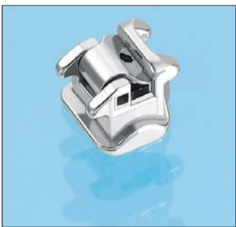
Quick>>2.0® – ein perfekt aufeinander abgestimmtes Bracketsystem für optimale Behandlungsergebnisse.

Das Quick®-Bracket von FORESTADENT verletzt keine GAC-Lizenz. Zu diesem Ergebnis kamen am 7. Juli 2009 nun auch die Richter des US-