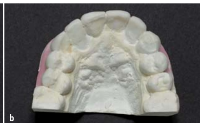
Abb. 5a, b: Vorsimulation des möglichen Endergebnisses am Gipsmodell.

gulation daher auch „präprothetische Regulation“. Die restliche Nivellierung erfolgt dann durch die Kombination mit Schritt zwei, dem Veneering, d. h. mit der Versorgung mit Keramikschalen.