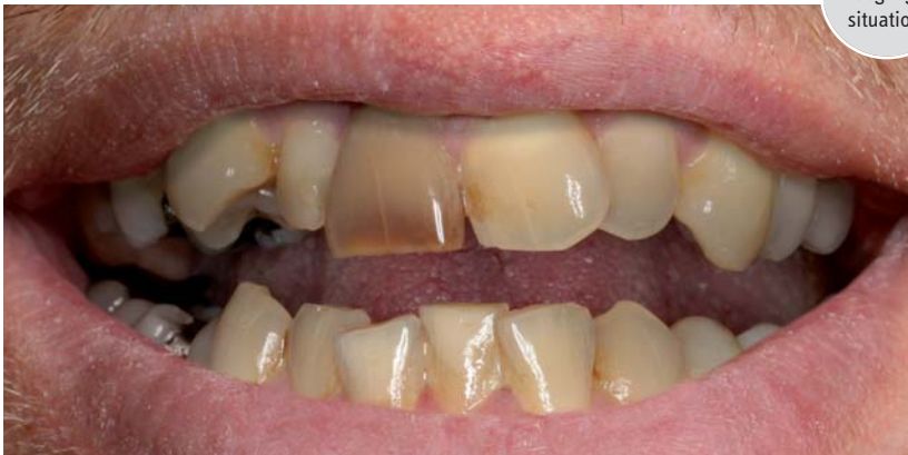
Abb. 3: Ausgangs- situation.

Das Neue an der vorgestellten Methode ist, dass sie zwei verbesserte Einzelverfahren verwendet und diese obendrein miteinander kombiniert, sodass sie zusammen ein perfektes, schneller zu erzielendes und preiswerteres Ergebnis ermöglicht.