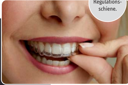
Abb. 1: Regulations- schiene.