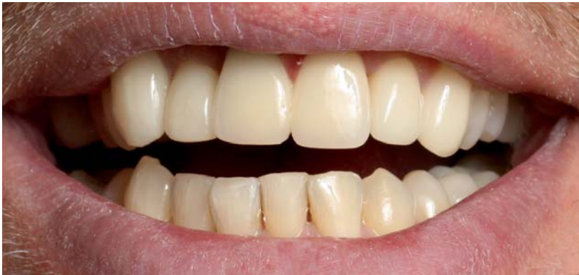
Abb. 7: Ergebnis nach Bleaching-Behandlung und Veneer-Versorgung im Oberkiefer.

verschönerung schnell, perfekt ästhetisch, ohne nennenswerte Substanzverluste und dazu noch relativ preiswert – selbst in schweren Fällen – möglich.