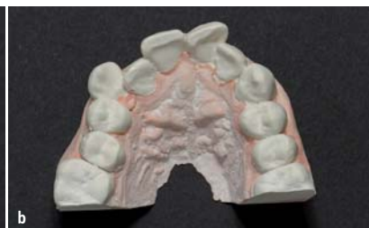
Abb. 4a, b: Gipsmodell der Ausgangssituation.