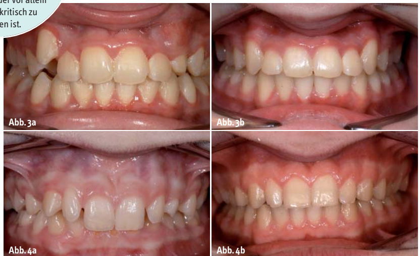
Abb. 3 und Abb. 4: Beispiele für ästhetisch bedingte Behandlungen, die aber ebenfalls funktionelle Faktoren beinhalten. In Abbildung 3a ist deutlich zu sehen, dass über 13 keine Eckzahnführung erfolgen kann. Abbildung 4a stellt einen Deckbiss dar, der vor allem funktionell kritisch zu bewerten ist.

In den meisten Fällen sind es in Deutschland die Eltern, die eine Fehlstellung im frühen Kindesalter registrieren