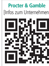
Procter & Gamble (Infos zum Unternehmen)

Aktuelle Weiterbildungs- oder Messeterminen abrufen, rund um die Uhr im Onlineshop zu Oral-B Praxis-Dauerpreisen bestellen und diverse Produktproben sowie Informationsmaterial zu Produkten oder zur Patientenunterweisung ordern – all das und noch vieles mehr ist auf www.dentalcare.com möglich. Die Onlineplattform bietet registrierten Mitgliedern somit eine Vielzahl von attraktiven Vorteilen, wodurch sie sich ganz klar als Startseite im Browser von „Dental Professionals“ qualifiziert. Warum es sich lohnt, die Website von Oral-B genauer kennenzulernen, erfahren Besucher der IDS 2015 in