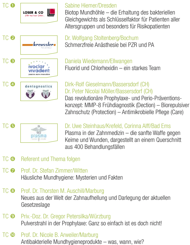
TABLE CLINICS (TC)

09.00 – 11.00 Uhr Wissenschaftliche Vorträge 11.00 – 15.20 Uhr Table Clinics 15.20 – 16.45 Uhr Wissenschaftliche Vorträge