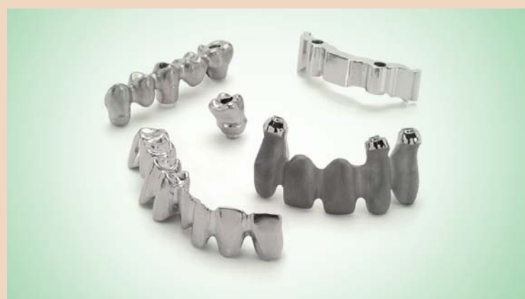
Heraeus Kulzer hält das Patent auf die Herstellung von Implantatsuprastrukturen mit gefrästem abgewinkelten Schraubenkanal wie der cara I-Bridge®, der cara I-Bar® und dem cara I-Butment®.