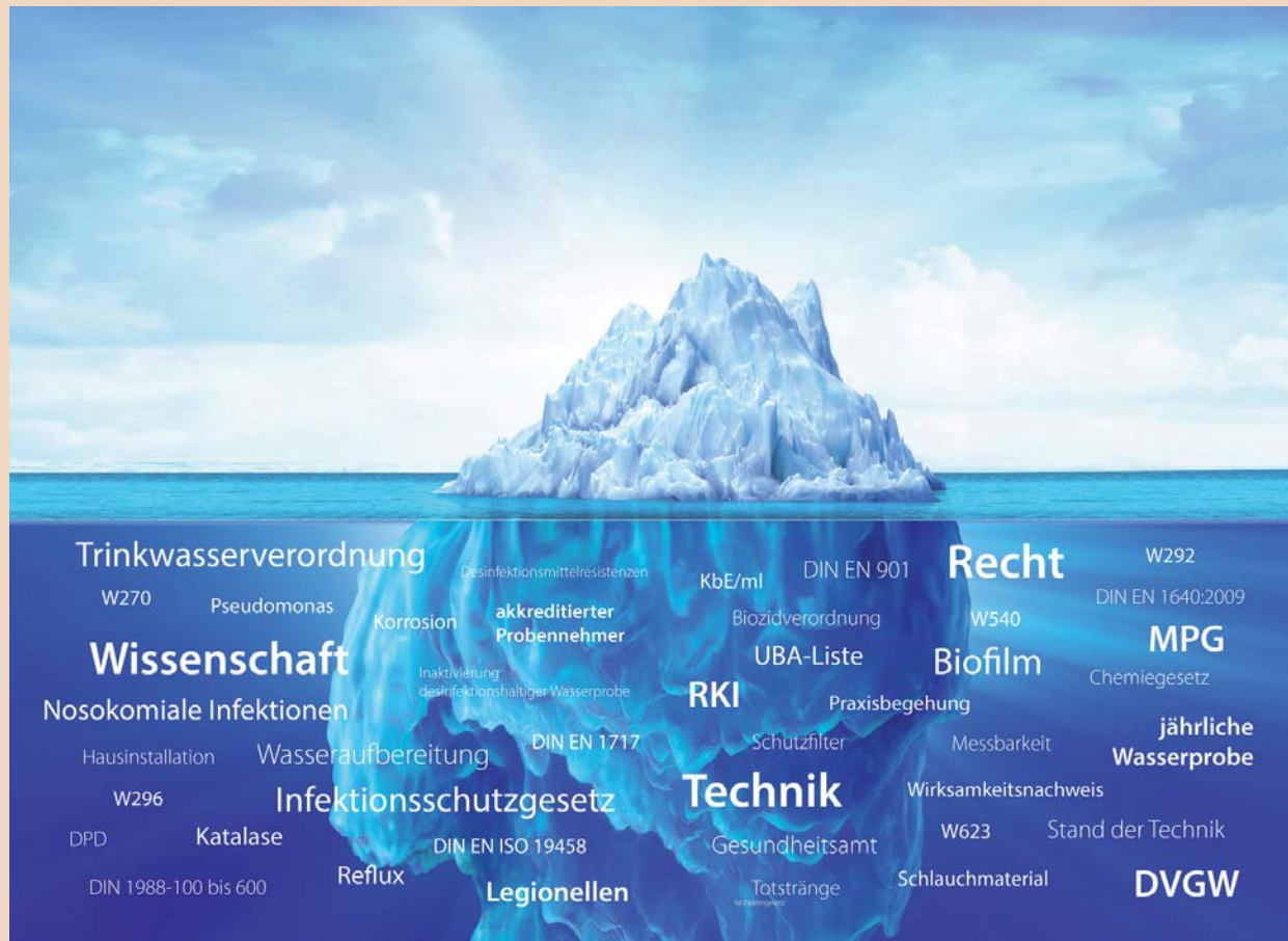
Das komplexe Thema der Wasserhygiene: Unsichtbare Gesetze, Verordnungen und Gefahrenquellen.

J. P.: Der Erfolg von Desinfektionsmaßnahmen lässt sich nur mit korrekt durchgeführten Beprobungen nachweisen. Das ist nicht unproblematisch. Denn beim Einsatz chemischer Desinfektionsverfahren ist bei der Probenahme stets auf ein geeignetes Inaktivierungsmittel in der richtigen Konzentration in den Probenahmegefäßen zu achten. Wird dies unterlassen oder nicht korrekt berechnet, ist die Analyse verfälscht. Zu lange Kontaktzeiten und die hohe Konzentration der Biozide, wie H 2 O 2 in den Probenahmegefäßen reduzieren die Anzahl der aus dem Biofilm losgelösten Keime auf den Weg ins Labor erheblich. Wir haben nun das erste Probenahmegefäß entwickelt, das H 2 O 2 inaktiviert. Das Produkt stellen wir auf der IDS 2015 als eine unserer Innovationen vor.