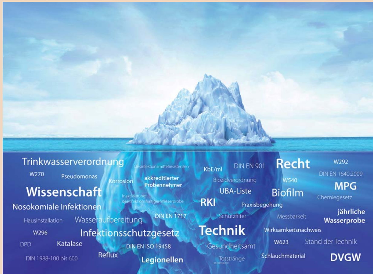
Das komplexe Thema der Wasserhygiene: Unsichtbare Gesetze, Verordnungen und Gefahrenquellen.

J. P.: Der Erfolg von Desinfektionsmaßnahmen lässt sich nur mit korrekt durchgeführten Beprobungen nachweisen. Das ist nicht unproblematisch. Denn beim Einsatz chemischer Desinfektionsverfahren ist bei der Probenahme stets auf ein geeignetes Inaktivierungsmittel in der richtigen Konzentration in den Probenahmegefäßen zu achten. Wird dies unterlassen oder nicht korrekt berechnet, ist die Analyse verfälscht. Zu lange Kontaktzeiten und die hohe Konzentration der Biozide, wie H_2O_2 in den Probenahmegefäßen reduzieren die Anzahl der aus dem Biofilm losgelösten Keime auf den Weg ins Labor erheblich. Wir haben nun das erste Probenahmegefäß entwickelt, das H_2O_2 inaktiviert. Das Produkt stellen wir auf der IDS 2015 als eine unserer Innovationen vor.