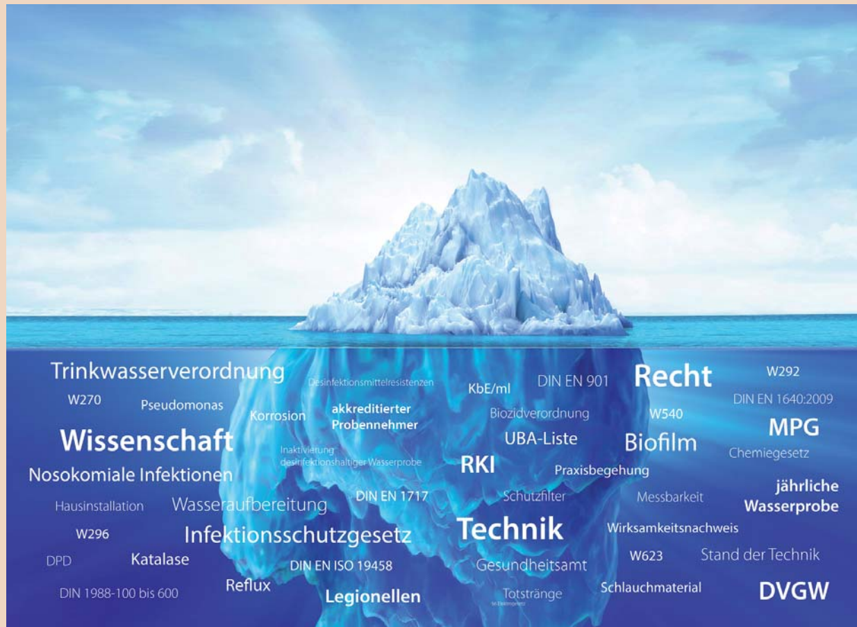
Das komplexe Thema der Wasserhygiene: Unsichtbare Gesetze, Verordnungen und Gefahrenquellen.

J. P.: Der Erfolg von Desinfektionsmaßnahmen lässt sich nur mit korrekt durchgeführten Beprobungen nachweisen. Das ist nicht unproblematisch. Denn beim Einsatz chemischer Desinfektionsverfahren ist bei der Probenahme stets auf ein geeignetes Inaktivierungsmittel in der richtigen Konzentration in den Probenahmegefäßen zu achten. Wird dies unterlassen oder nicht korrekt berechnet, ist die Analyse verfälscht. Zu lange Kontaktzeiten und die hohe Konzentration der Biozide, wie H 2 O 2 in den Probenahmegefäßen reduzieren die Anzahl der aus dem Biofilm losgelösten Keime auf den Weg ins Labor erheblich. Wir haben nun das erste Probenahmegefäß entwickelt, das H 2 O 2 inaktiviert. Das Produkt stellen wir auf der IDS 2015 als eine unserer Innovationen vor.