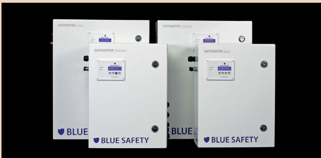
SAFEWATER-Anlagen: Einziges RKI-konformes und rechtssicheres Wasserhygiene-System in Deutschland.

Ihr Unternehmen hat seinen Hauptsitz in Münster. Gibt es dafür Gründe?