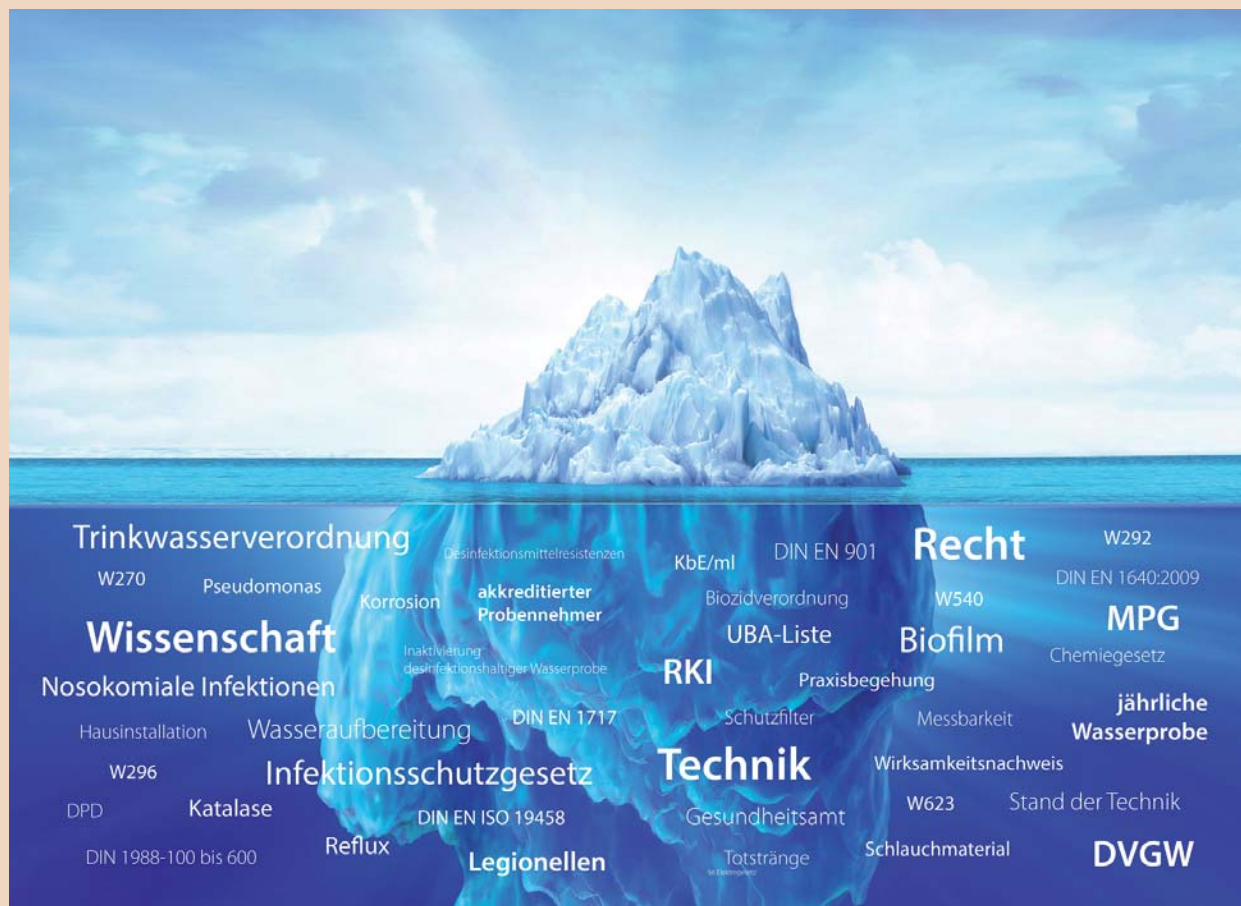
Das komplexe Thema der Wasserhygiene: Unsichtbare Gesetze, Verordnungen und Gefahrenquellen.

J. P.: Der Erfolg von Desinfektionsmaßnahmen lässt sich nur mit korrekt durchgeführten Beprobungen nachweisen. Das ist nicht unproblematisch. Denn beim Einsatz chemischer Desinfektionsverfahren ist bei der Probenahme stets auf ein geeignetes Inaktivierungsmittel in der richtigen Konzentration in den Probenahmegefäßen zu achten. Wird dies unterlassen oder nicht korrekt berechnet, ist die Analyse verfälscht. Zu lange Kontaktzeiten und die hohe Konzentration der Biozide, wie H 2 O 2 in den Probenahmegefäßen reduzieren die Anzahl der aus dem Biofilm losgelösten Keime auf den Weg ins Labor erheblich. Wir haben nun das erste Probenahmegefäß entwickelt, das H 2 O 2 inaktiviert. Das Produkt stellen wir auf der IDS 2015 als eine unserer Innovationen vor.