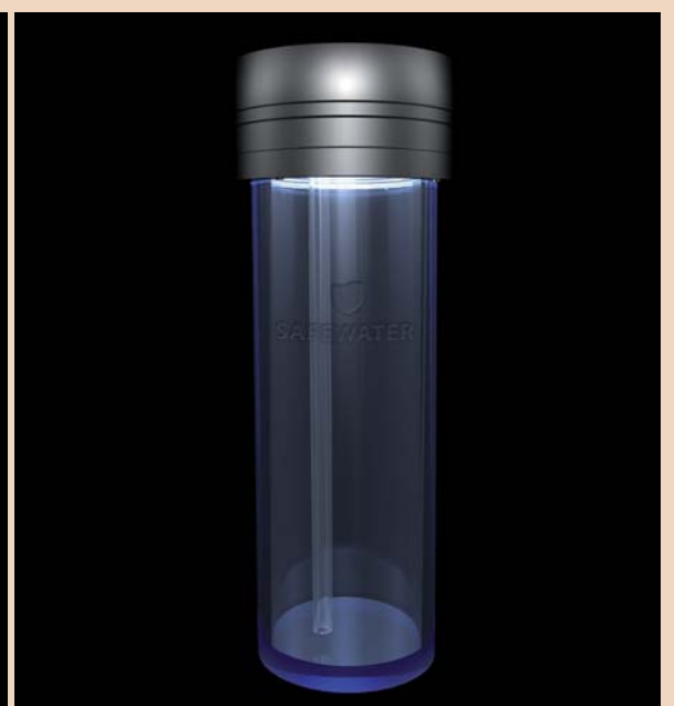
Das innovative Bottle-Care-System von BLUE SAFETY.