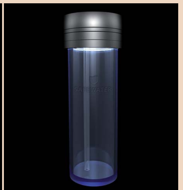
Das innovative Bottle-Care-System von BLUE SAFETY.