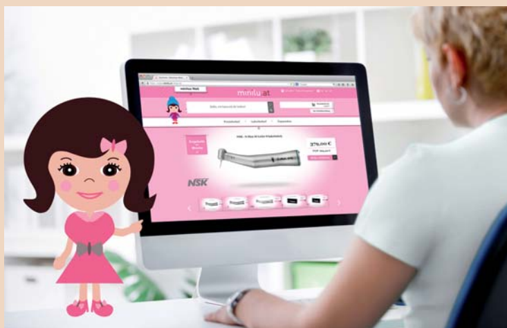
Die niedliche Comicfigur minilu gibt Praxistipps für effizienteres Arbeiten.

Der Onlineshop sorgt darüber hinaus für spielerische Abwechslung bei der Bestellroutine: mit dem Mini-Quiz oder der Weisheit des Tages rund um Zahnthemen oder indem die Nutzer das Aussehen der Seite und minilus Look verändern können. In der minilu Academy stellt minilu unter Beweis, dass sie sich als gute Freundin des Praxisteam versteht. In kurzen Video-Tutorials verrät die niedliche Comicfigur Reparaturanleitungen und gibt Praxistipps für effizienteres Arbeiten.