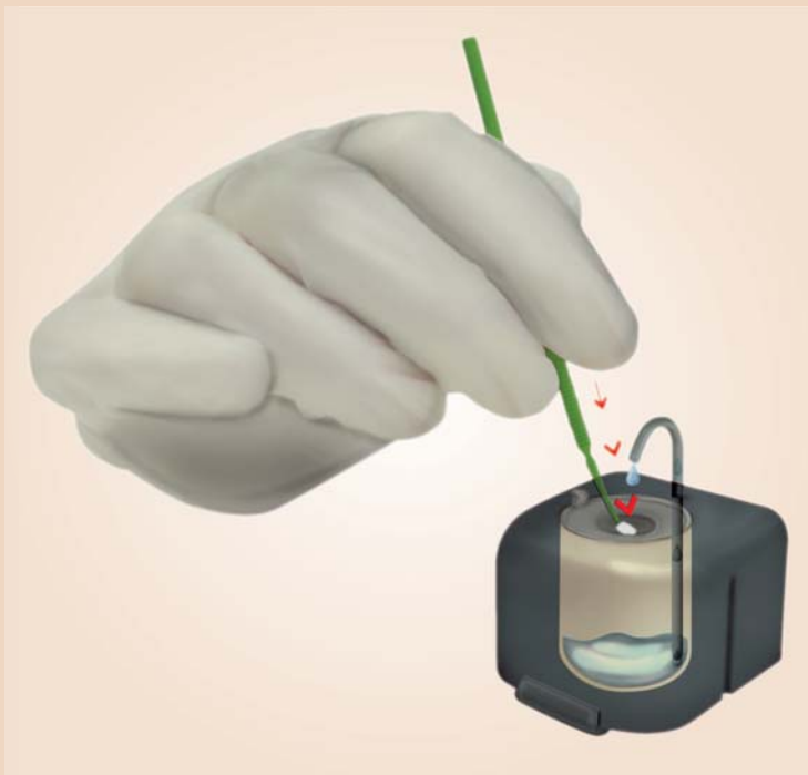
Funktionalität des Hy-Drops Forte.

Der Flüssigkeitsspender Hy-Drop Forte von Polydentia SA.