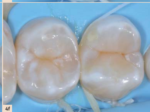
Abb. 1: Schwere Erosionen können funktionelle und ästhetische Probleme verursachen, sie sind aber kaum für Extraktionen verantwortlich. Die häufigste Extraktionsursache, insbesondere bei jüngeren Patienten, ist immer noch die Karies. – Abb. 2: Neutralisation von bakterienproduzierten Säuren kann durch den Einsatz von argininhaltigen Zahnpasten durchgeführt werden, wie z.B. die neue Elmex Kariesschutz Professional. – Abb. 3: Curodont Repair basiert auf einem „self-assembling“ Peptid und soll zu einer Regeneration nichtkavittierter initialer Läsionen beitragen. – Abb. 4: Klinisches Vorgehen bei der nichtinvasiven adhäsiven Restauration im Approximalbereich: – Abb. 4a: Nichtkavitierte proximale kariöse Läsionen an den Zähnen 14d und 15m. – Abb. 4b: Nach dem Anlegen des Kofferdams einmaliges Durchfahren des approximalen Kontaktes und anschließender mechanischer Entfernung des Biofilms und der hypermineralisierten oberflächlichen Schmelzschicht unter der approximalen Kontaktfläche mit einem feinen Metallstreifen. – Abb. 4c: Ätzung der mesialen und distalen approximalen Schmelzwand mit konventionellem Phosphorsäuregel. – Abb. 4d: Abspülen des Ätzgels mit Wasser, Wasserspray und Trocknen mit komprimierter Luft und Äthanol. – Abb. 4e: Applikation eines selbststehenden Einkomponentenadhäsivs mit einem Mikroapplikator in den Approximalraum. – Abb. 4f: Verteilen des Einkomponentenadhäsivs mit nicht gewachster Zahnseide und Penetration in die Initialkaries für zwei Minuten sowie Entfernung der Überschüsse mit einem Mikroapplikator und durch intensives Verblasen.