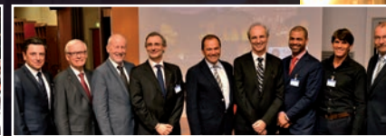
* Änderungen des Programmablaufs vorbehalten!