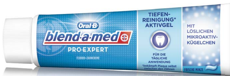
PRO-EXPERT Tiefenreinigung* Aktivgel

Entdecken Sie die außergewöhnlichen Vorteile der exklusiven Rezeptur mit stabilisiertem Zinnfluorid und Natriumhexametaphosphat für Mundgesundheit und Ästhetik 1