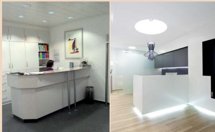
Empfangsbereich vor der Neugestaltung. – Empfangsbereich nach dem „Facelift“.

Wir fragen uns, für was ein Objekt oder ein Stil stehen: für welche Materialien, welche Art der Verarbeitung, welche Farbwelten, welche Traditionen. Danach setzen wir die Dinge konsequent ein. Wir haben schon Böden aus Kunststoff gegossen, aber häufig auch Echtholz verlegt. Wir setzen oft Corian als Werkstoff ein, weil dessen seidig glatte Oberfläche einfach fantastisch ist. Aber wir nutzen genauso traditionelle Materialien, spielen mit Licht oder gestalten Flächen grafisch.