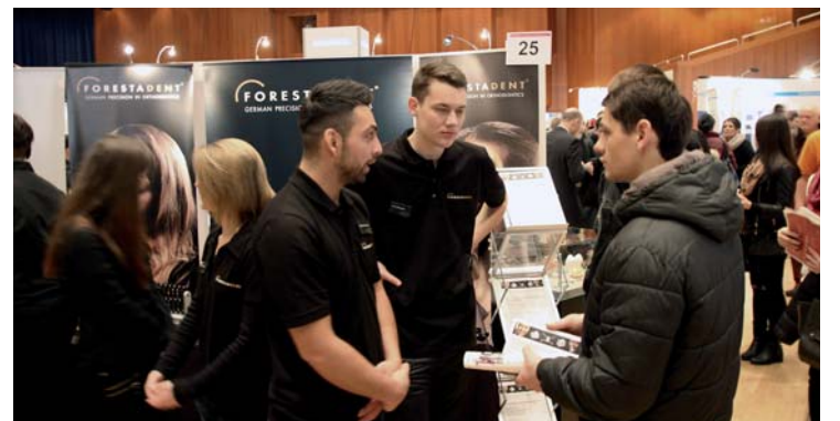
Im Rahmen der „Beruf aktuell 2015“ informierte FORESTADENT künftige Schulabgänger über die Ausbildungsmöglichkeiten beim Pforzheimer Traditionsunternehmen.

Am 24. Januar öffnete die diesjährige „Beruf aktuell 2015“ ihre Pforten. Rund 180 Aussteller aus der Region Pforzheim, dem Enzkreis sowie den angrenzenden Regionen Nagold, Karlsruhe, Rastatt und Stuttgart waren vertreten – darunter auch FORESTADENT. Das Pforzheimer Un-