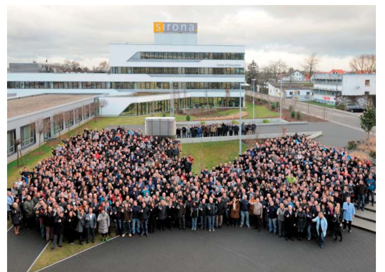
Der Weltmarktführer bietet vielseitige Ausbildungsmöglichkeiten sowie internationale Karriereperspektiven in einer Branche mit exzellenten Wachstumschancen.

Am Samstag, dem 14. März, findet zum ersten Mal der Career Day auf der Internationalen Dental-Schau (IDS) 2015 in Köln statt. In der „Speakers Corner“ dreht sich an diesem Tag alles um die Themen Ausbildung, Berufsperspektiven und Karriereplanung in der Dentalbranche. Mitten drin präsentiert sich Sirona, der Markt- und Innovationsführer, als globaler Top-Arbeitgeber. Mit dem „Career Day“ steht Absolventen und Professionals auf der größten internationalen Dentalmesse eine völlig neue Plattform zur Verfügung, um potenzielle Arbeitgeber kennenzulernen. Auch Sirona lässt sich diese Gelegenheit nicht entgehen: Der Weltmarktführer lädt zu einem Kennenlernen in die „Recruiting Lounge“ ein und stellt Einstiegs- und Entwicklungsmöglichkeiten vor. Auf der „Career Day“-Bühne in Halle 3.1 der Koelnmesse wird Sirona am Samstag, dem 14. März, zwei spannende Vorträge halten: Um 10 Uhr und um 14 Uhr bekommen Interessierte unter dem Titel „Global market leadership requires world class HR“ einen Einblick in das Unternehmen. Wer es genauer wissen möchte, kann Sirona persönlich kennenlernen: Zwischen 10 und 16 Uhr stehen in der „Recruiting Lounge“, direkt neben der „Career Day“-Bühne, erfahrene HR-Business Partner von Sirona allen Absolventen und Professionals mit weiteren Karriereambitionen für Gespräche