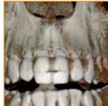
>> 3D Diagnostik FOV 5 x 5 cm