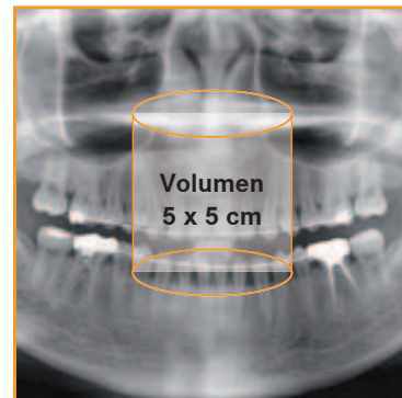
>> verbesserte Sinus Darstellung