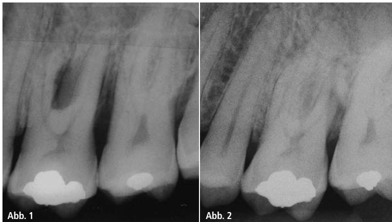
Abb. 1: Das Röntgenbild zeigt die präoperative Situation. Der Oberkiefermolar hat einen deutlichen Furkationsbefall. – Abb. 2: Das postoperative Röntgenbild zeigt den gleichen Zahn, sechs Monate später, nach geschlossenem Vorgehen. Klinisch wie röntgenologisch ist kein Furkationsbefall mehr feststellbar. Die Sondierungstiefen lagen zwischen 1 und 3 mm.

Das Problem besteht vor allem in Bezug auf das Knochenangebot. So kann bei einem guten Knochenangebot der Zahn erhalten werden. Ist ein Zahn parodontal jedoch nicht mehr erhaltungsfähig, fehlt auch der Knochen für eine Implantation, sodass diese entweder gar nicht oder nur nach aufwendigen augmentativen Maßnahmen möglich ist. Also werden häufig bereits Zähne mit einer leichten bis moderaten parodontalen Erkrankung/Destruktion entfernt, damit ausreichend Knochen für eine Implantatinsertion zur Verfügung steht. Damit wird vorausgesetzt,