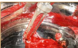
Mehrfachbohrer mit Sammelkammer für autologes Knochenmaterial