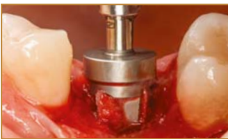
Tiefen- / Anschlagstop