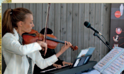
Classic on the Beach 2014