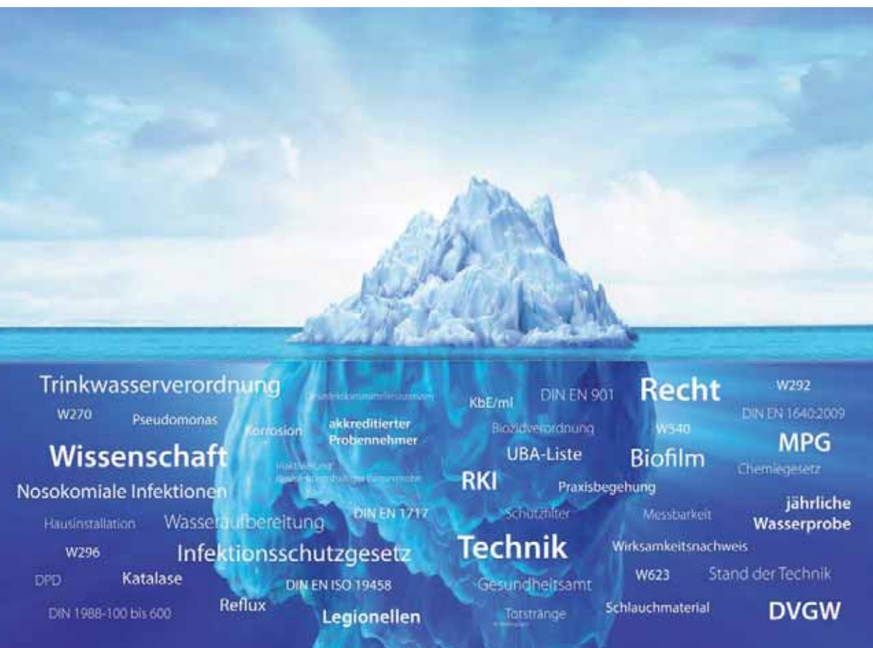
* Das komplexe Thema der Wasserhygiene: unsichtbare Gesetze, Verordnungen und Gefahrenquellen.