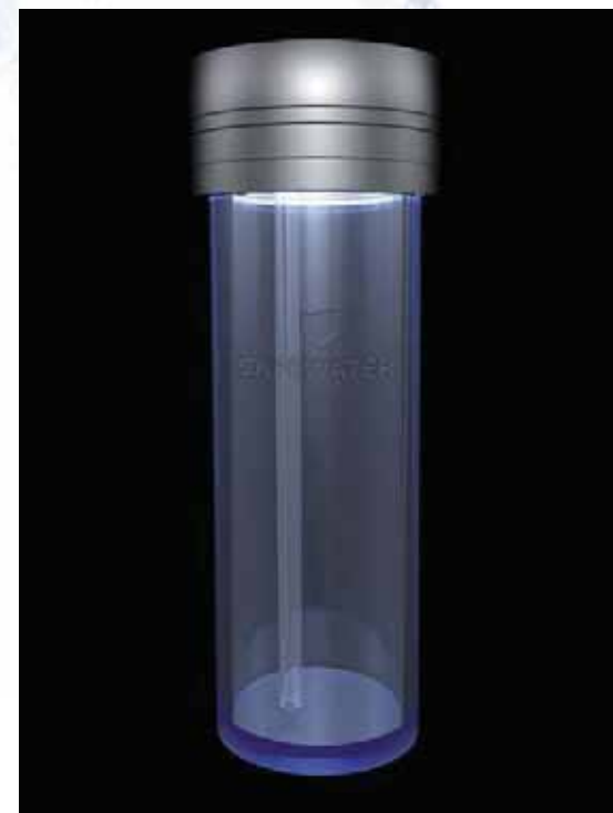
* Das innovative BLUE SAFETY Bottle-Care-System.

BLUE SAFETY hat von Anfang an großen Wert auf Forschung und Entwicklung gelegt und jährlich einen hohen Anteil vom Umsatz in Neu- und Weiterentwicklungen investiert. Passend zu diesem innovationsgetriebenen Unternehmenskonzept ist das Unternehmen nun eine neue Partnerschaft eingegangen. Neuer Kooperationspartner der BLUE SAFETY GmbH ist die goDentis – Gesellschaft für Innovation in der Zahnheilkunde mbH