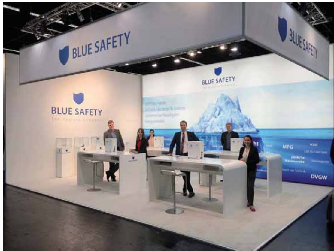
* The Hygiene Company. Das Team der BLUE SAFETY GmbH freute sich über die vielen Besucher und gute Gespräche.

Innovationen gab es auch am Messestand der BLUE SAFETY GmbH aus Münster. Auf der IDS präsentierte das Unternehmen die neue Generation der SAFEWATER-Anlagen sowie zwei Produktinnovationen im Bereich Wasserhygiene. SAFEWATER ist das einzige RKI-konforme und rechtssichere Wasserhygiene-Konzept und seit Jahren der Marktführer in Deutschland. Das Konzept ist ganzheitlich, denn im Vergleich zu den meisten herkömmlichen Wasserhygieneprodukten für die Dentalmedizin wird das System gemietet anstatt gekauft. In einem festen monatlichen Preis ist alles inklusive: Beratung vor Ort, technische Analyse der Örtlichkeiten und Gegebenheiten innerhalb der Praxis, komplette Installation und Inbetriebnahme der Anlage, die Validierung, regelmäßige Probennahmen, der Wartungsservice, alle Anfahrten, die Einweisung ins Qualitäts- und Risikomanagement, das Einpflegen der erforderlichen Ein-