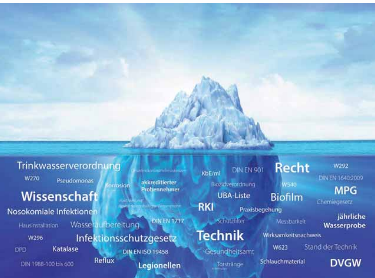
* Das komplexe Thema der Wasserhygiene: unsichtbare Gesetze, Verordnungen und Gefahrenquellen.