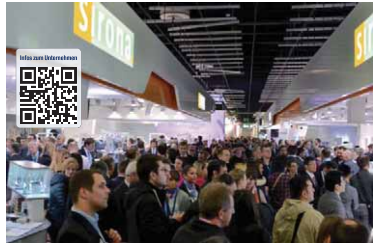
* Der Sirona Messestand war an allen Messtagen ein Besuchermagnet.

CEREC erwies sich als Anziehungspunkt auf der Messe: In Live-Demonstrationen wurden Patienten an Ort