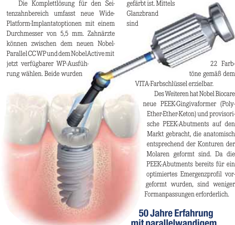
22 Farbtöne gemäß dem VITA-Farbschlüssel erzielbar.

entwickelt mit prothetischer Flexibilität. Dadurch eignet sie sich ideal für den Einsatz im Molarenbereich. Sie ist in acht Farbtönen erhältlich, wobei das Material vollständig mit der Farbe durchgefärbt ist. Mittels Glanzbrand sind