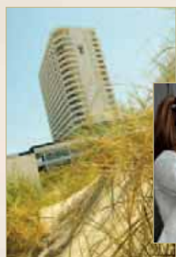
Classic on the Beach 2014