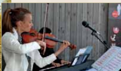
Classic on the Beach 2014