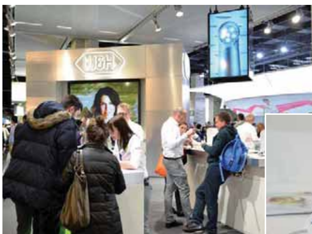
Oben: Der W&H-Messestand auf der IDS 2015 lockte jeden Tag zahlreiche Besucher. - Unten links: Piezo Ultraschall Scaler Tigon. - Mitte: Chirurgieeinheit Elcomed SA-310 Anwenderfreundlich, Qualität und Stärke auf höchstem Niveau. - Rechts: Kabelloses Entran mit extra kleinem Kopf und Endodontie Winkelstücke.

Jüngstes Beispiel der erfolgreichen W&H Entwicklungsserie im Bereich der Oralchirurgie ist das „Piezomed“, das erstmals 2013 einem breiten Fachpublikum