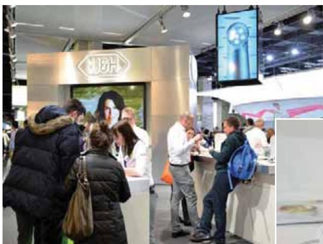
Oben: Der W&H-Messestand auf der IDS 2015 lockte jeden Tag zahlreiche Besucher. - Unten links: Piezo Ultraschall Scaler Tigon. - Mitte: Chirurgieeinheit Elcomed SA-310 Anwenderfreundlich, Qualität und Stärke auf höchstem Niveau. - Rechts: Kabelloses Entran mit extra kleinem Kopf und Endodontie Winkelstücke.

Jüngstes Beispiel der erfolgreichen W&H Entwicklungsserie im Bereich der Oralchirurgie ist das „Piezomed“, das erstmals 2013 einem breiten Fachpublikum