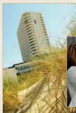
Classic on the Beach 2014