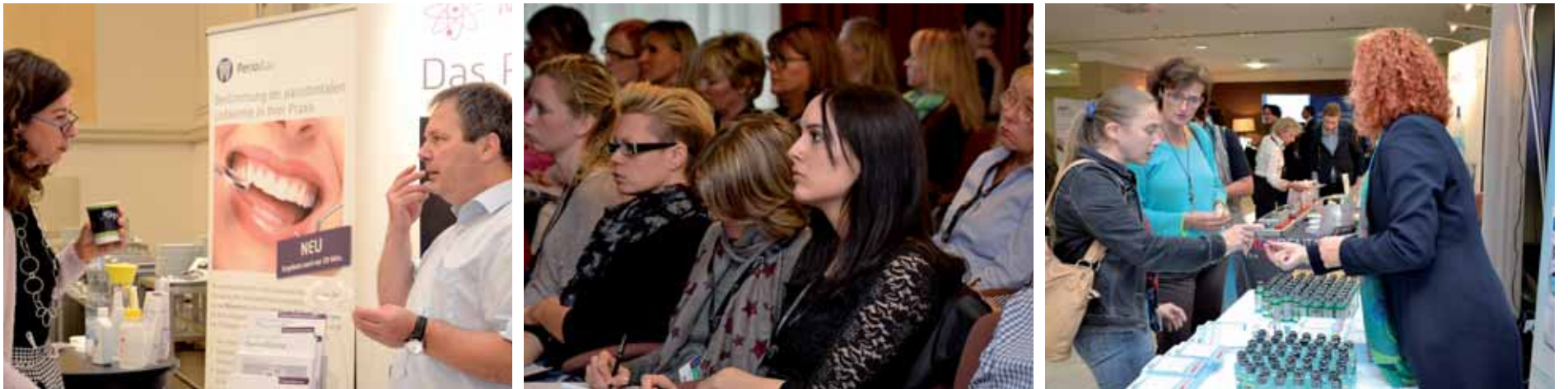
Nach dem Erfolg der letztjährigen Veranstaltung lädt der Präventions- und Mundgesundheitstag 2015 am 8. Mai im ATLANTIC Congress Hotel Essen erneut zum wissenschaftlichen und praktischen Erfahrungsaustausch.