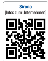
Sirona [Infos zum Unternehmen]

Das Top Employers Institute zertifiziert weltweit Arbeitgeber mit besonders guten Personalführung und -strategie. Das bisher unter dem Namen CRF Institute bekannte Zertifizierungsunternehmen hat seinen Hauptsitz in den Niederlanden und zeichnet bereits seit 1991 weltweit die Top Employers aus. KN