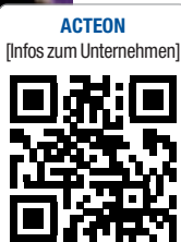
ACTEON [Infos zum Unternehmen]

ACTEON Germany GmbH Industriestraße 9 40822 Mettmann Tel.: 02104 956510 Fax: 02104 956511 info@de.acteongroup.com http://de.acteongroup.com