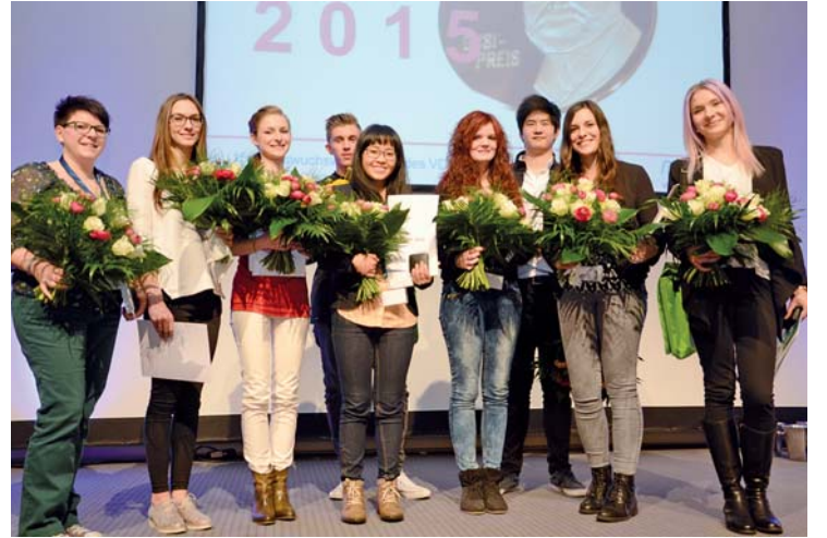
Die Gewinner des Gysi-Preises 2015.