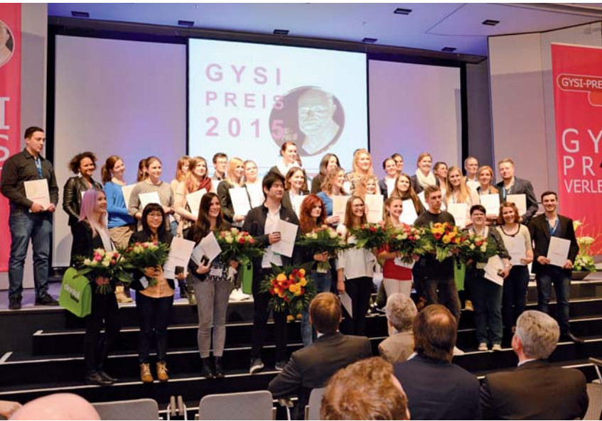
Alle Teilnehmer und Gewinner des Gysi-Preises 2015.