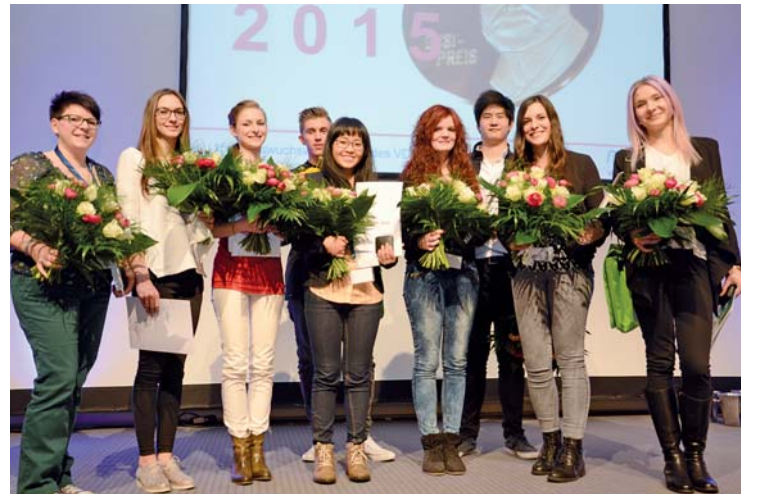
Die Gewinner des Gysi-Preises 2015.