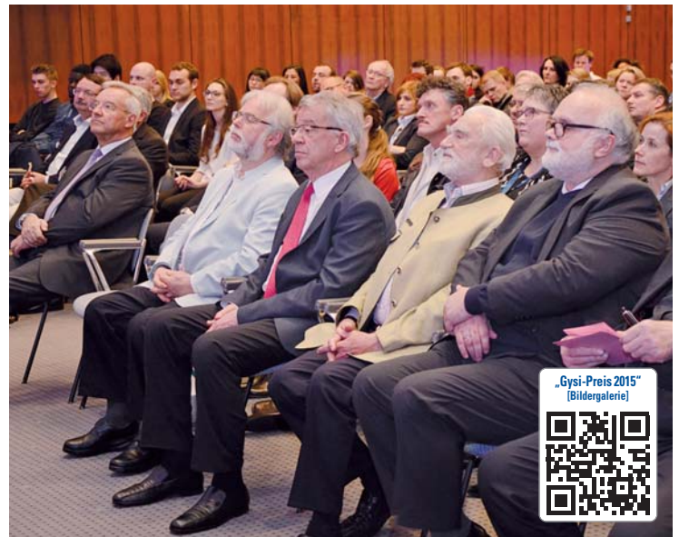
Blick ins Podium.