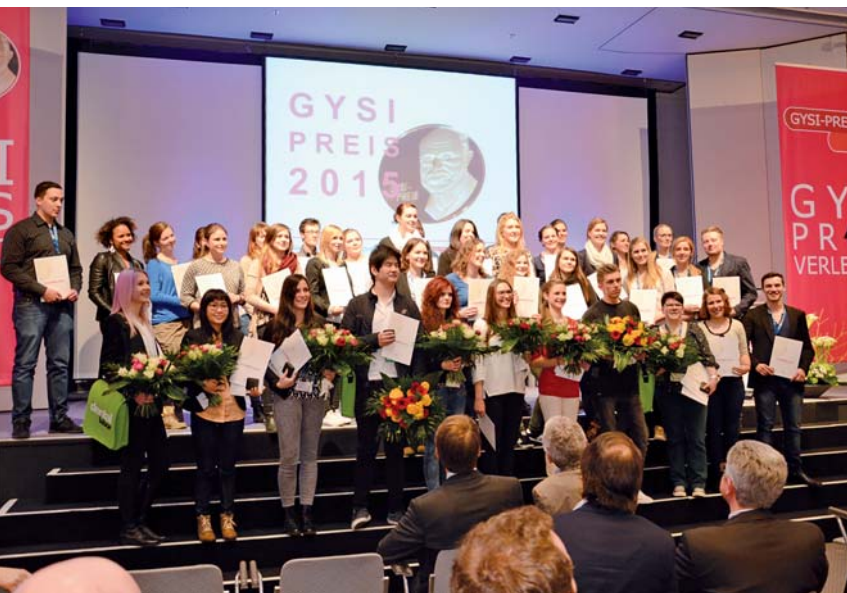
Alle Teilnehmer und Gewinner des Gysi-Preises 2015.