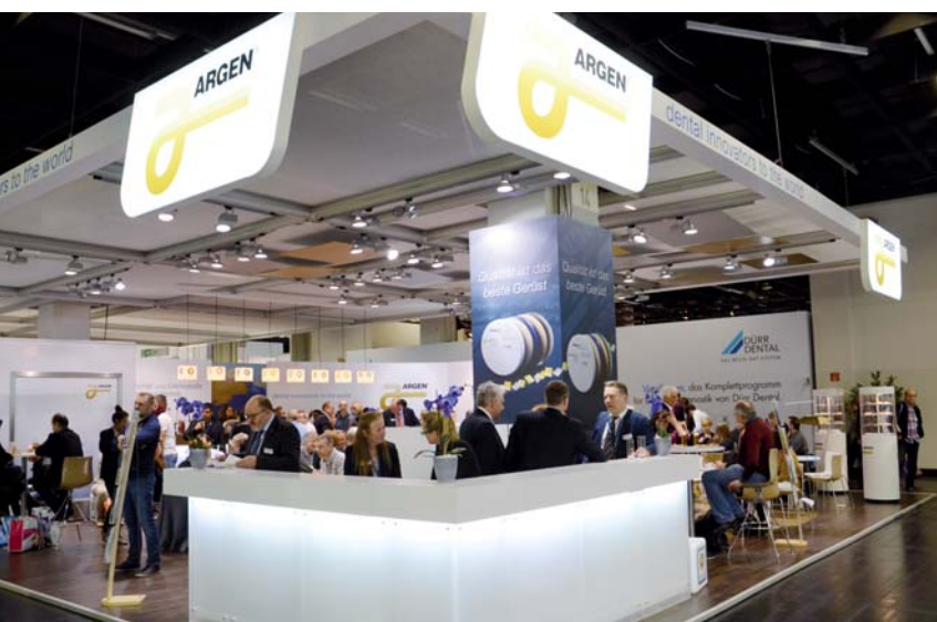
ARGEN Dental präsentierte seine Produkte zur IDS 2015.

ARGEN Dental Werdener Str. 4 40227 Düsseldorf Tel.: 0211 355965-0 Fax: 0211 355965-19 info@argen.de www.argen.de