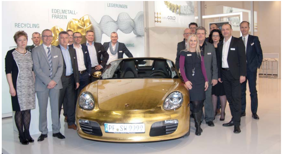
Die C.HAFNER-Mannschaft steht geschlossen für Gold in der Zahnmedizin.

gerungen im Edelmetallbereich und, immer häufiger nachgefragt, auch Anlagegold in Form eigener formschöner Barren in zahlreichen Stückelungen. Nicht unerwähnt bleiben soll in diesem Zusammenhang die Zertifizierung durch die London Bullion Market Association, die