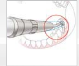
Perfekter Zugang durch schlanke Düse und ergonomische Düsenpitze