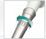
Pulverfluss-Regulierung am Handstück