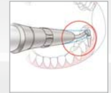
Perfekter Zugang durch schlanke Düse und ergonomische Düsen-spitze

REF Y1002658 für Bien-Air® Unifix® Kupplung