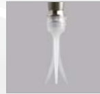
Hygienische, ultra-flexible Einmal-Düsen-spitze (steril verpackt)