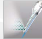
Pulverfluss-Regulierung mit Powder-Control-Ring