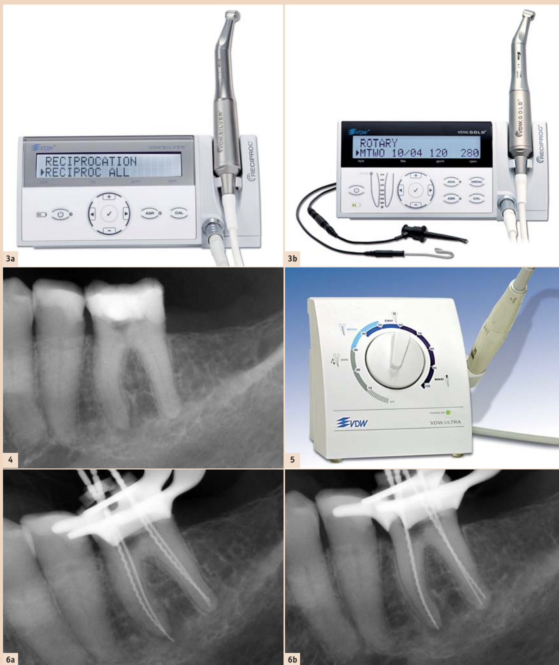
Abb. 3a: VDW.SILVER® RECIPROC® Motor. – Abb. 3b: VDW.GOLD® RECIPROC® Motor – mehr Bedienoptionen und integrierte elektrometrische Längenbestimmungsmöglichkeit. – Abb. 4: Zahn 36 Übersichtsaufnahme, orthoradial. – Abb. 5: Ultraschallgerät VDW.ULTRA®. – Abb. 6a: Orthoradiale Messaufnahme – leichte Überinstrumentierung mesial. – Abb. 6b: Exzentrische Messaufnahme – Korrektur der mesialen Arbeitslänge.

Durch Anwendung moderner Hilfsmittel – von der diagnostischen Phase bis zur Obturation – kann die endodontische Therapie eine gute Vorhersagbarkeit und Erfolgsquote erreichen. Der Zahnerhalt stellt somit eine solide Behandlungsalternative dar. IT