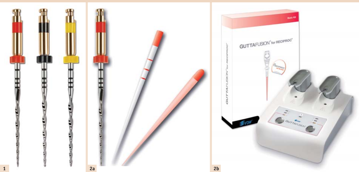
Abb. 1: RECI-PROC®-Instrumentenset. – Abb. 2a: RECI-PROC®-Set: Instrument, Papier- und Guttaperchaspitze, hier Spitzendurchmesser 0,25 mm. – Abb. 2b: Trägerbasiertes Obturationssystem abgestimmt für RECI-PROC®-Instrumente.

gang und die mangelnde Sicht der zu behandelnden Bereiche, die komplizierte Kanalanatomie – wie z. B. Einengungen, Obliterationen und Kanalkrümmungen, die eingeschränkte Erreichbarkeit aller Kanalwandbereiche durch die Wurzelkanalinstrumente mit daraus resultierender insuffizienter Reduktion der bakteriellen Kontamination, sowie die oft mangelnde Effizienz in der Formgebung durch die mechanische Kanalaufbereitung, welche auch eine erschwerte Wurzelkanalfüllung mit nicht ausreichender bakteriendichter Versiegelung des desinfizierten Kanalsystems nach sich zieht.