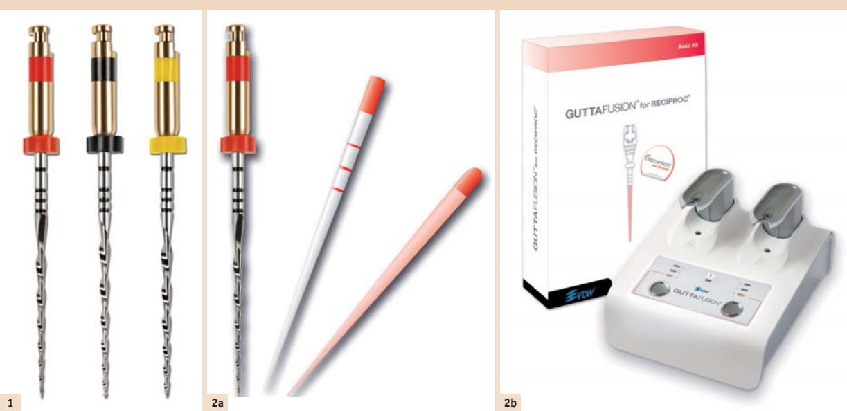
Abb. 1: RECI-PROC®-Instrumentenset. – Abb. 2a: RECI-PROC®-Set: Instrument, Papier- und Guttaperchaspitze, hier Spitzendurchmesser 0,25 mm. – Abb. 2b: Trägerbasiertes Obturationssystem abgestimmt für RECI-PROC®-Instrumente.

gang und die mangelnde Sicht der zu behandelnden Bereiche, die komplizierte Kanal Anatomie – wie z. B. Einengungen, Obliterationen und Kanalkrümmungen, die eingeschränkte Erreichbarkeit aller Kanalwandbereiche durch die Wurzelkanalinstrumente mit daraus resultierender insuffizienter Reduktion der bakteriellen Kontamination, sowie die oft mangelnde Effizienz in der Formgebung durch die mechanische Kanalaufbereitung, welche auch eine erschwerte Wurzelkanalfüllung mit nicht ausreichender bakteriendichter Versiegelung des desinfizierten Kanalsystems nach sich zieht.