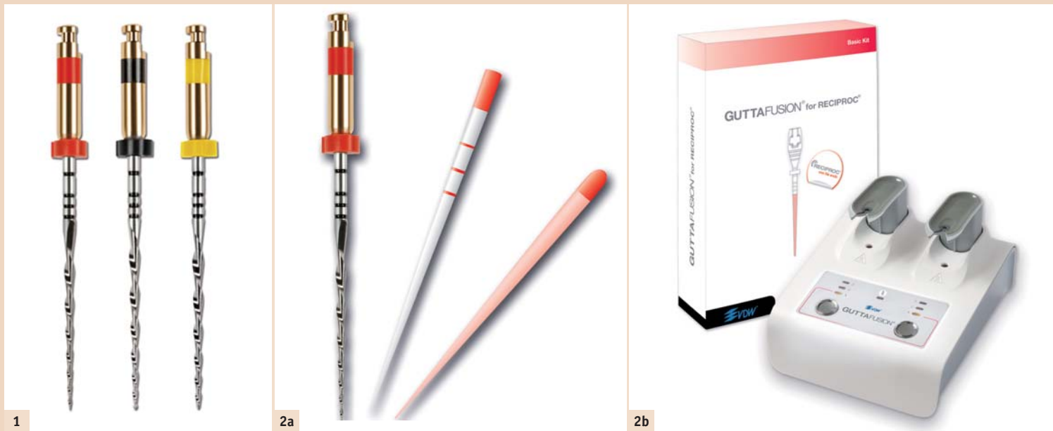
Abb. 1: RECIPROC®-Instrumentenset. – Abb. 2a: RECIPROC®-Set: Instrument, Papier- und Guttaperchaspitze, hier Spitzendurchmesser 0,25 mm. – Abb. 2b: Trägerbasiertes Obturationssystem abgestimmt für RECIPROC®-Instrumente.

zierte Kanalanatomie – wie z.B. Einengungen, Obliterationen und Kanalkrümmungen, die eingeschränkte Erreichbarkeit aller Kanalwandbereiche durch die Wurzelkanalinstrumente mit daraus resultierender insuffizienter Reduktion der bakteriellen Kontamination, sowie die oft mangelnde Effizienz in der Formgebung durch die mechanische Kanalaufbereitung, welche auch eine erschwerte Wurzelkanalfüllung mit nicht ausreichender bakteriedichter Versiegelung des desinfizierten Kanalsystems nach sich zieht.