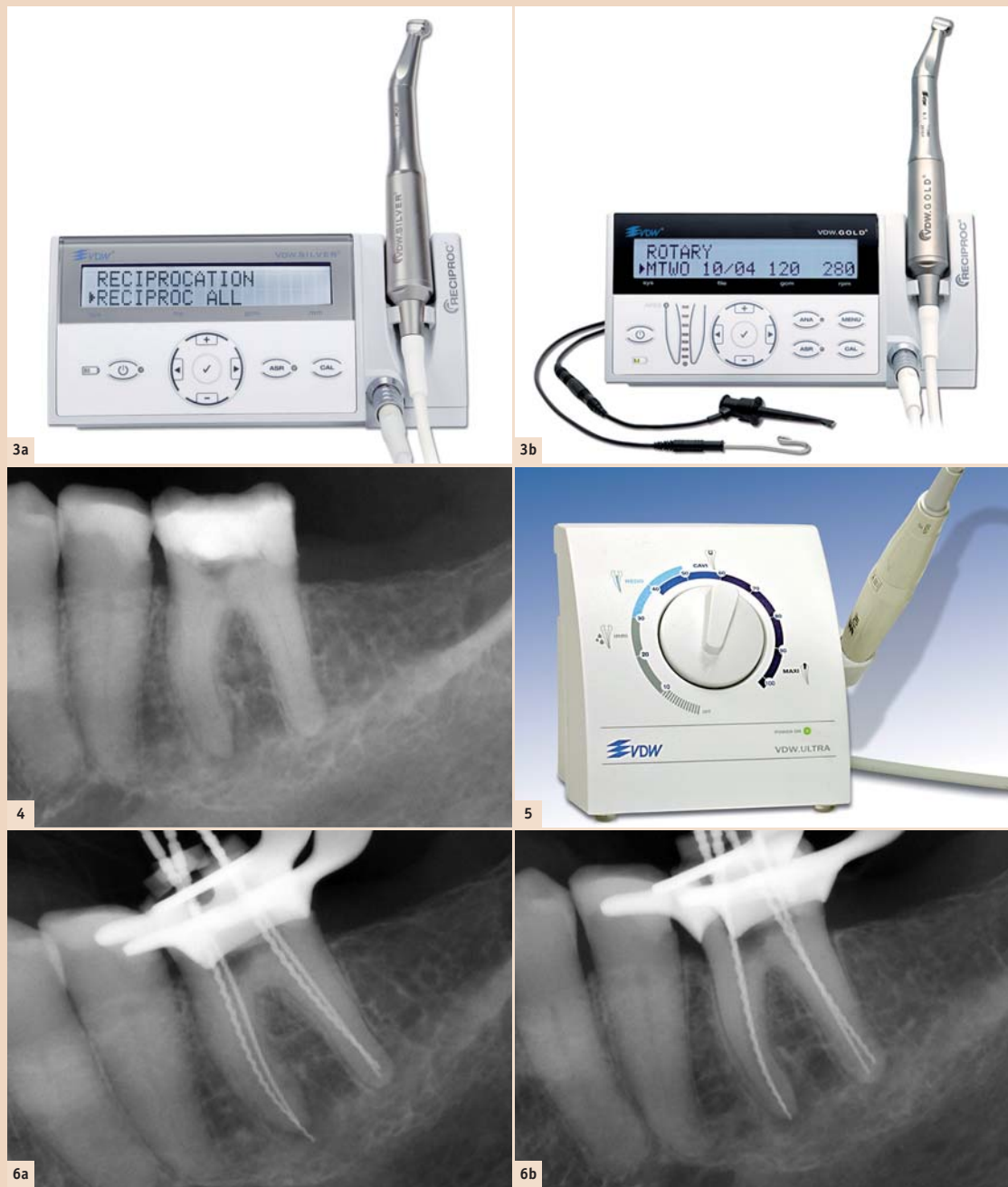
Abb. 3a: VDW.SILVER® RECIPROC® Motor. – Abb. 3b: VDW.GOLD® RECIPROC® Motor – mehr Bedienungsoptionen und integrierte elektrometrische Längenbestimmungsmöglichkeit. – Abb. 4: Zahn 36 Übersichtsaufnahme, orthoradial. – Abb. 5: Ultraschallgerät VDW.ULTRA®. – Abb. 6a: Orthoradiale Messaufnahme – leichte Überinstrumentierung mesial. – Abb. 6b: Exzentrische Messaufnahme – Korrektur der mesialen Arbeitslänge.

Durch Anwendung moderner Hilfsmittel – von der diagnostischen Phase bis zur Obturation – kann die endodontische Therapie eine gute Vorhersagbarkeit und Erfolgsquote erreichen. Der Zahnerhalt stellt somit eine solide Behandlungsalternative dar. [1]