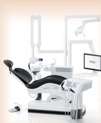
Digitale Vernetzung und Integration von Funktionen – das macht die neue Generation von Behandlungseinheiten von Sirona aus.

Die zur IDS 2015 vorgestellten Neuerungen machen TENEO jetzt zu einem wahren Endo-Experten: Erstmals werden in die Feilenbibliothek einer Behandlungseinheit die reziproken Feilensysteme von VDW (RECIPROC®) und DENTSPLY