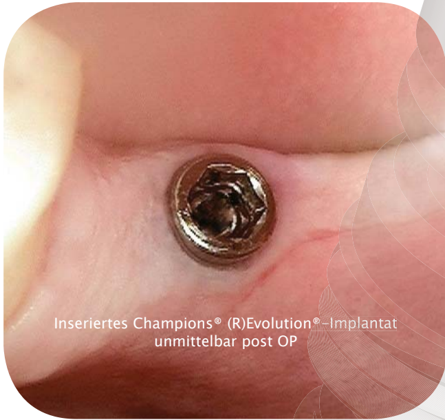
Inseriertes Champions® (R)Evolution®-Implantat unmittelbar post OP

Die sanfte & sichere Implantations-Methodik