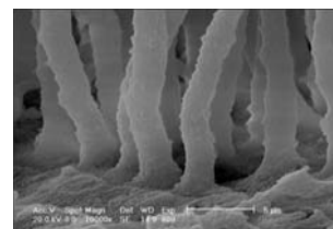
Die REM-Aufnahme (Vergrößert 10.000 x) zeigt die Affinität von EndoREZ zu Feuchtigkeit – es dringt tief in Seitenkanäle und Dentintubuli ein.