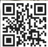
Bildergalerie: Komet auf der IDS 2015

Der H162ST stand im Mittelpunkt der IDS an der Demo-Theke für Zahnärztliche Chirurgie.