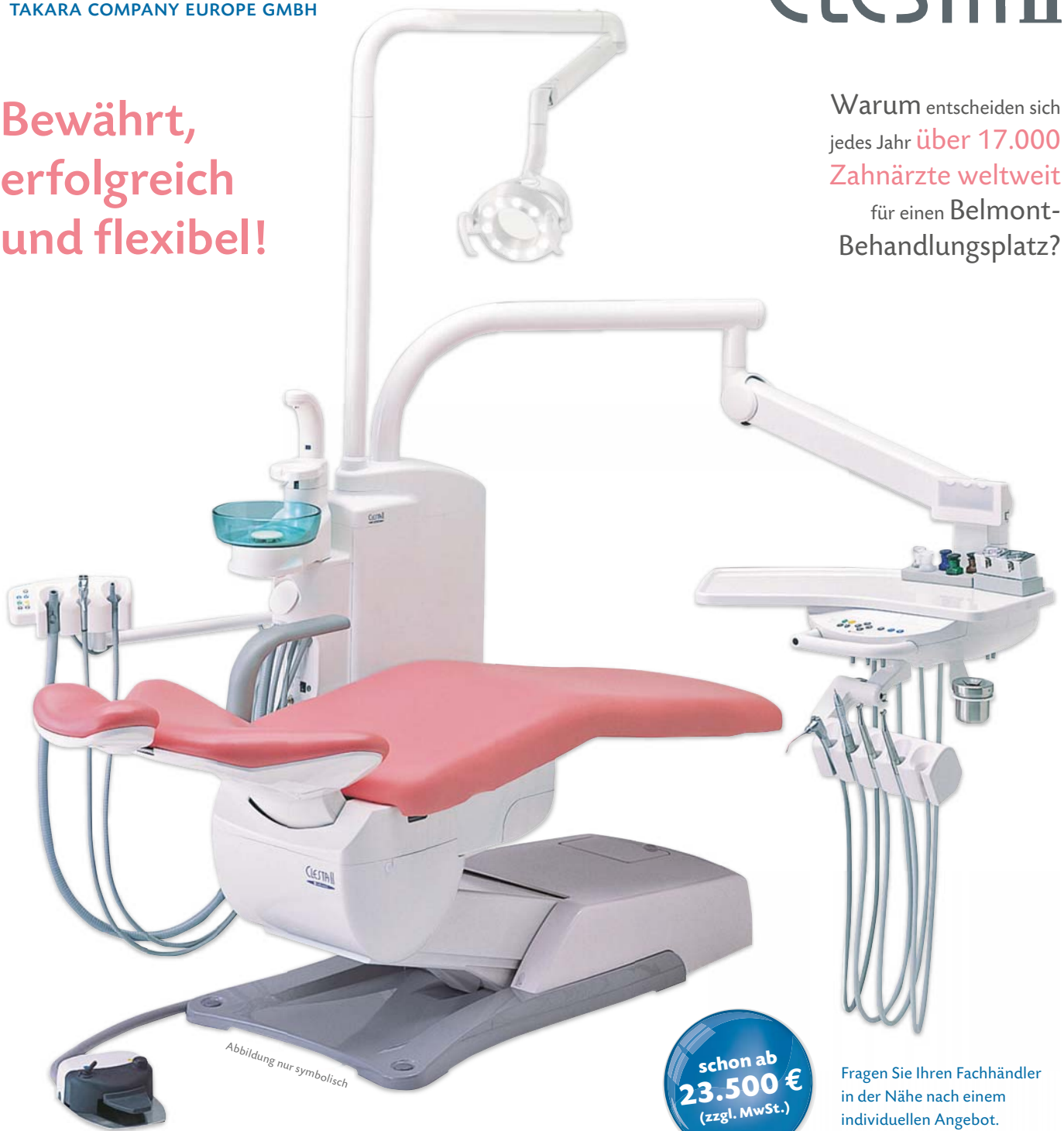
Abbildung nur symbolisch

Warum entscheiden sich jedes Jahr über 17.000 Zahnärzte weltweit für einen Belmont- Behandlungsplatz?