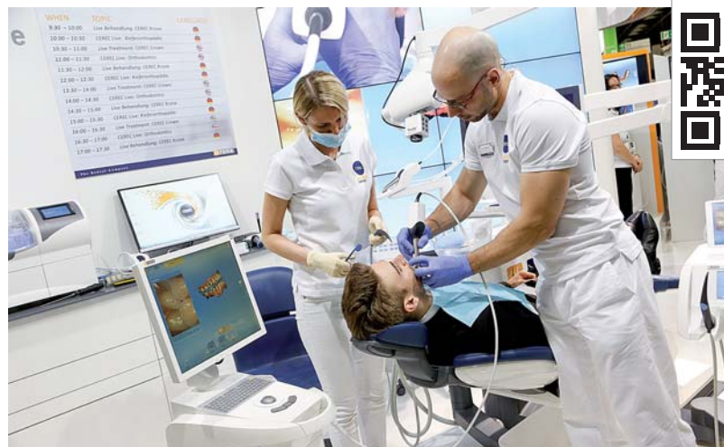
Abb. 4: Am Stand der Fa. Sirona.