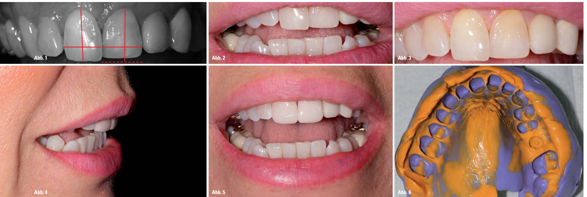
Abb. 1: Schwarz-Weiß-Aufnahme mit Darstellung der Zahntextur und -größe. – Abb. 2: Lippenprofil der Patientin vor der Behandlung. – Abb. 3: Close-up der Frontzahnsituation mit Darstellung des Farbspiels. – Abb. 4: Try-in Veneers mit Lateralansicht und Artikulation der Patientin (S-Laut). – Abb. 5: Frontalansicht der Try-in Veneers. – Abb. 6: Polyether-Abformung der Situation mit Try-in Veneers.

Non-Prep Veneers stellen nach wie vor die Königsdisziplin in der ästhetischen Veneer-Restauration dar, da sie ein hohes Maß an intensiver Diagnostik, optimale Voraussetzungen, eindeutige Kommunikation und überragende zahntechnische Qualitäten abverlangen.