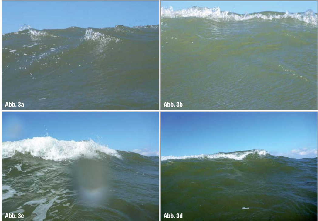
Abb. 3a–d_ Grobe See.

wird auf und ab bewegt – ohne weiterzuwandern. Es wird also nicht das Wasser mit der Wellenbewegung fortbewegt, sondern die Energie des durch den Wind angeregten Schwingungszustands der Wasseroberfläche.